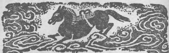
表 年 疑