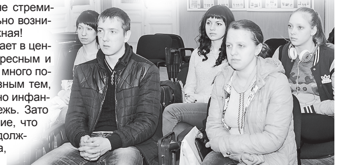
Четыре девушки да парень - вот и вся молодежь...