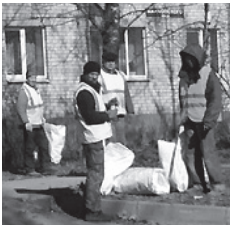
Первыми на уборку улиц вышли работники МУП «Спектр»

- Правила на этот счет предписывают, что руководители предприятий и организаций, на балансе которых находятся здания и сооружения, собственники зданий и сооружений обязаны обеспечить своевременное производство работ по реставрации, ремонту и покраске фасадов указанных объектов и их отдельных элементов, а также поддерживать в чистоте и исправном состоянии расположенные на фасадах информационные таблички, памятные доски. Хочу добавить - поверьте, это совершенно нормальная практика, когда житель, предприниматель - не важно, заботится о том месте, где он живет и работает. Мы привыкли, наверное, что какой-то волшебник с метлой и кисточкой должен прийти и все сделать за нас - убрать мусор, покрасить дом. Но так не будет. И если мы любим свой город, то и ответственность за его облик должны нести вместе.