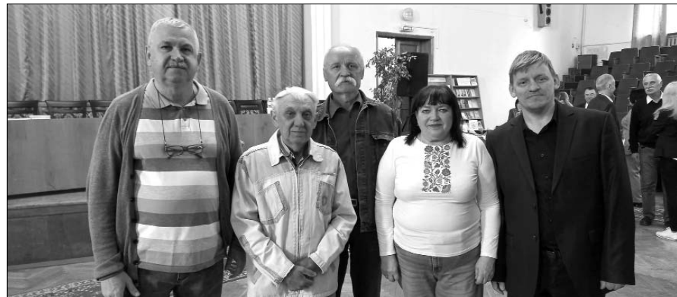
Краєзнавці Донеччини – учасники конференції