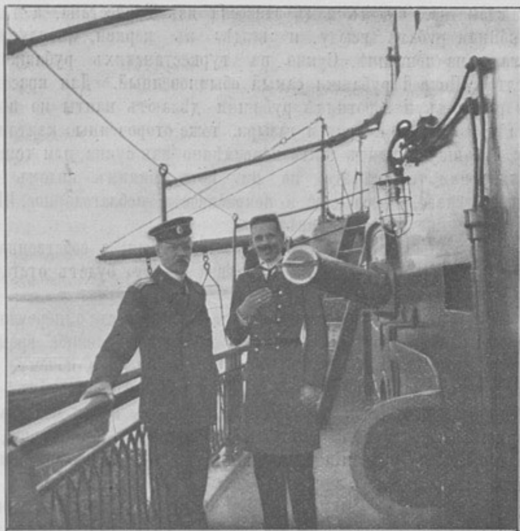
Старшій офицеръ на броненосцѣ «Императоръ Александръ III» капитанъ 2-го ранга гвардейскаго экипажа Владиміръ Алексѣевичъ Племянниковъ и прикомандированный къ экипажу мичманъ Александръ Александровичъ Адлербергъ. Погибли въ бою при Цусимѣ.