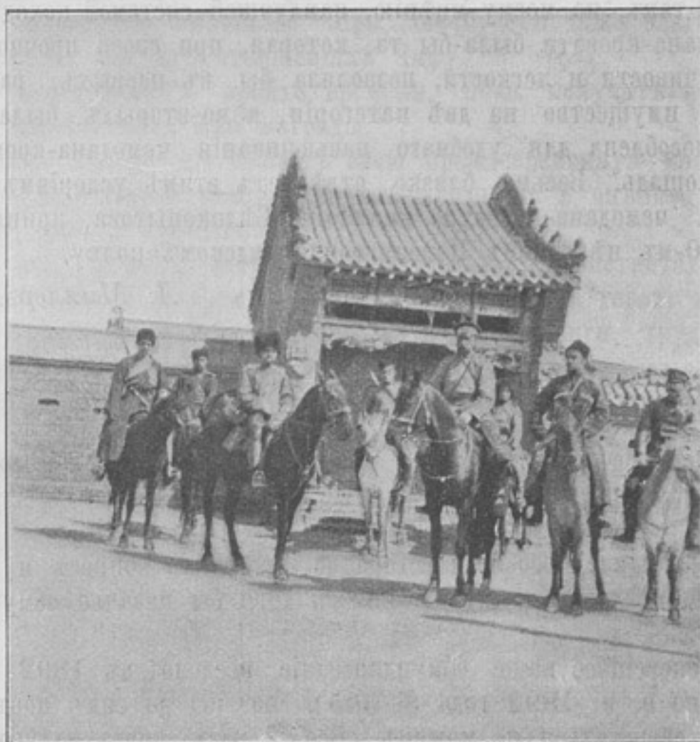
Передовой отрядъ генер. Толмачева. Генераль Толмачевъ съ начальникомъ штаба есауломъ Авъ Мейнандеромъ во вновь занятомъ нами гор. Цумошу 1-го апрѣля 1905 г. (Собств. корресп.).

Въ январскихъ бояхъ подъ Хейгуатаемъ былъ раненъ и контуженъ, но остался въ строю. Въ февральскихъ бояхъ подъ Юхуантунемъ вторично былъ раненъ пятью шрапнельными пулями.