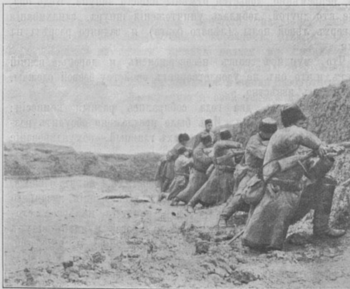
Рекогносцировка Чантафу передов. отряд. генер. Толмачева. Передовая застава задерживаетъ огнемъ японскую цѣпь (10-го апрѣля 1905 г.). (Собств. корресп.).