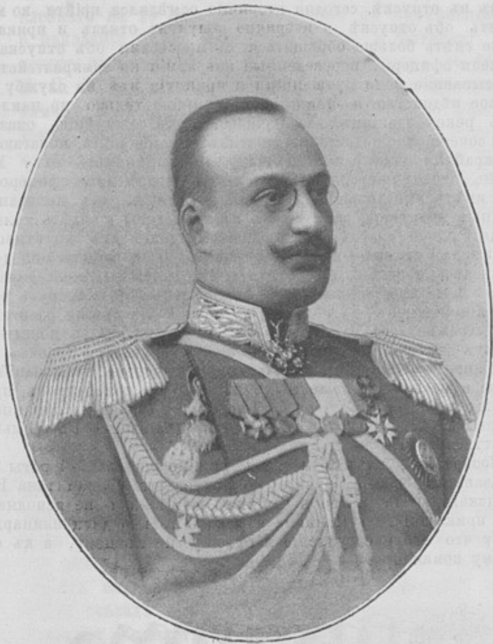
Ординарный профессор Николаевской академіи генеральнаго штаба и начальник канцеляріи Совѣта государственной обороны, генеральнаго штаба полковникъ