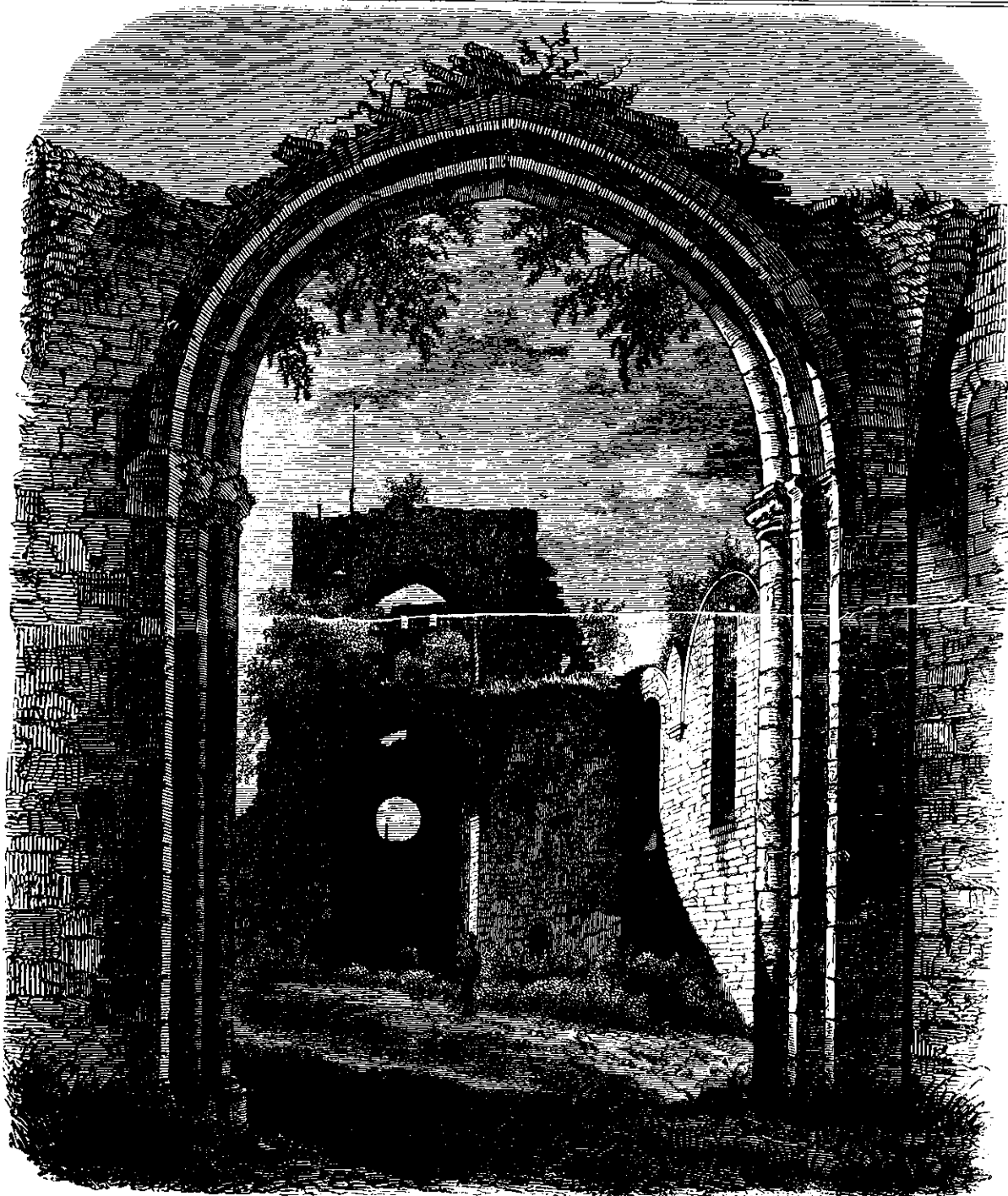
St. Clemens Kirke paa Gotland.