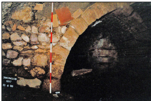
Arco del vall Cobert