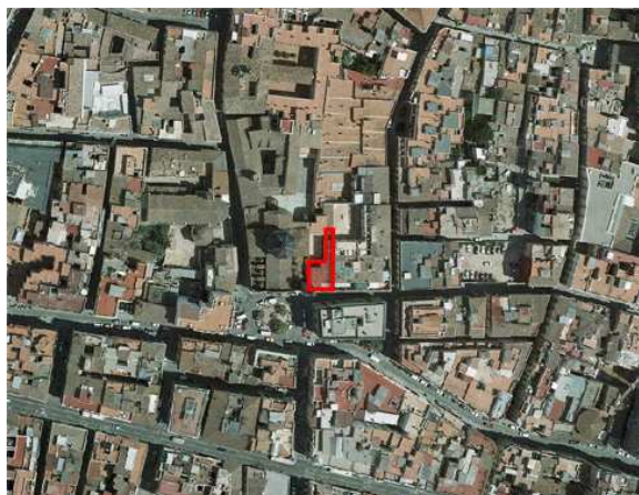
Foto aérea 2008 SIGESPA con ámbito arqueológico propuesto

Coordenadas UTM: X = 726.145,39 Y = 4.372.896,86 (Ver anexo parcelas catastrales) CART. CATASTRAL 401-22-I SUPERFICIE: 325,72 M2