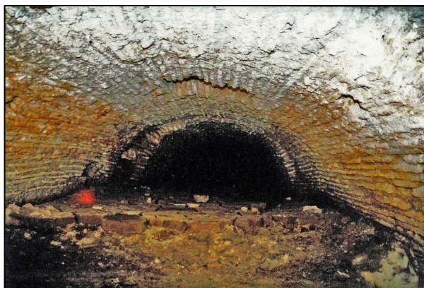
Vista del vall cobert antes de la excavación