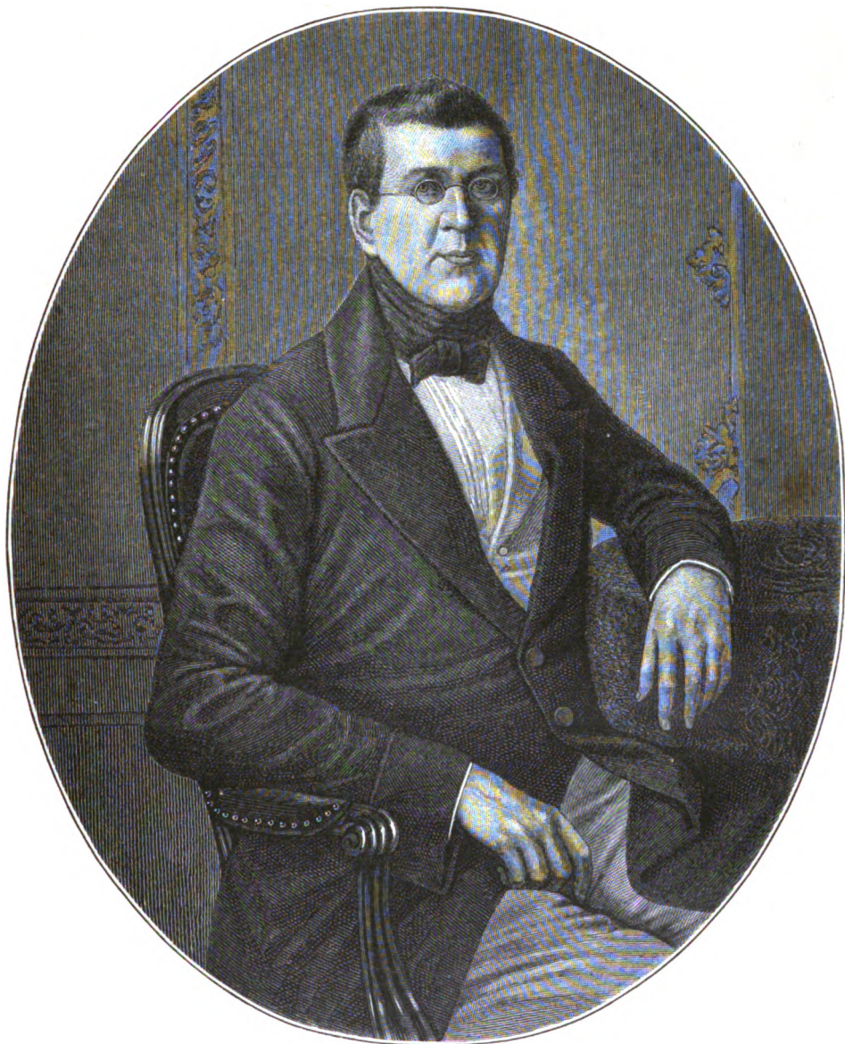
ГРАФЪ ВИКТОРЪ НИКИТИЧЪ ПАНИНЪ.