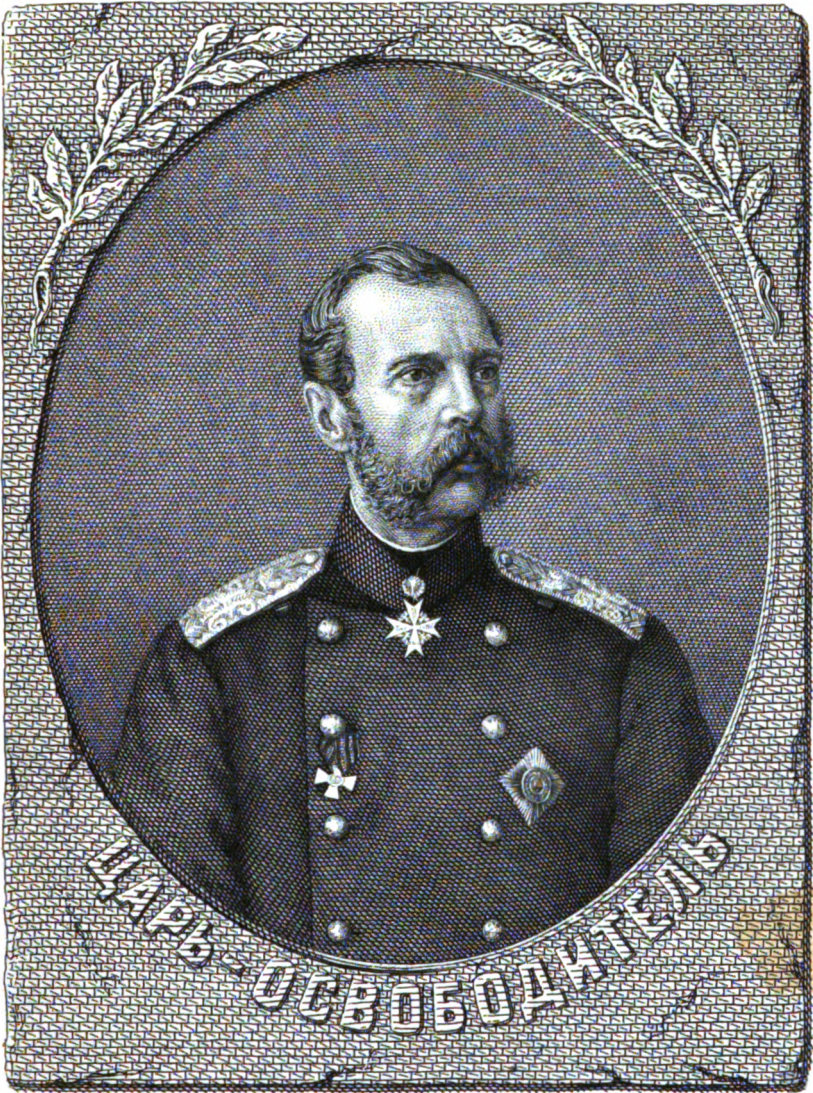
Рис. и грав. С. Пинкерт 1851

ПРИЛОЖЕНИЕ КЪ «РУССКОЙ СТАРИЦѢ» изд. 1886 г.