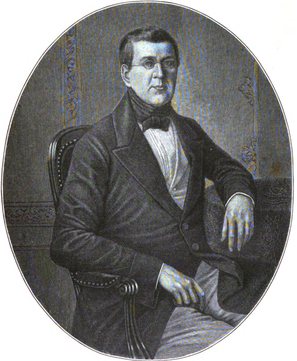
ГРАФЪ ВИКТОРЪ НИКИТИЧЪ ПАНИНЪ.