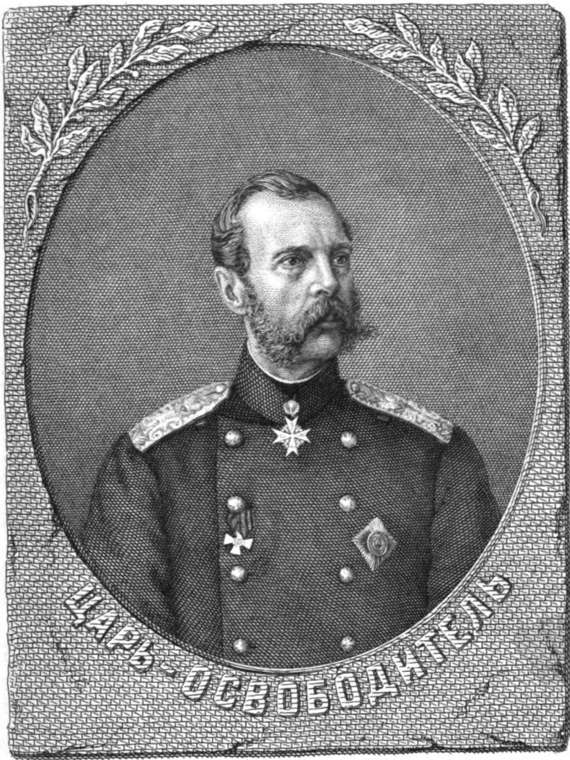
Рис. и грав. Е. Шершневъ 1855

ПРИЛОЖЕНИЕ КЪ «РУССКОЙ СТАРИЦѢ» изд. 1886 г.