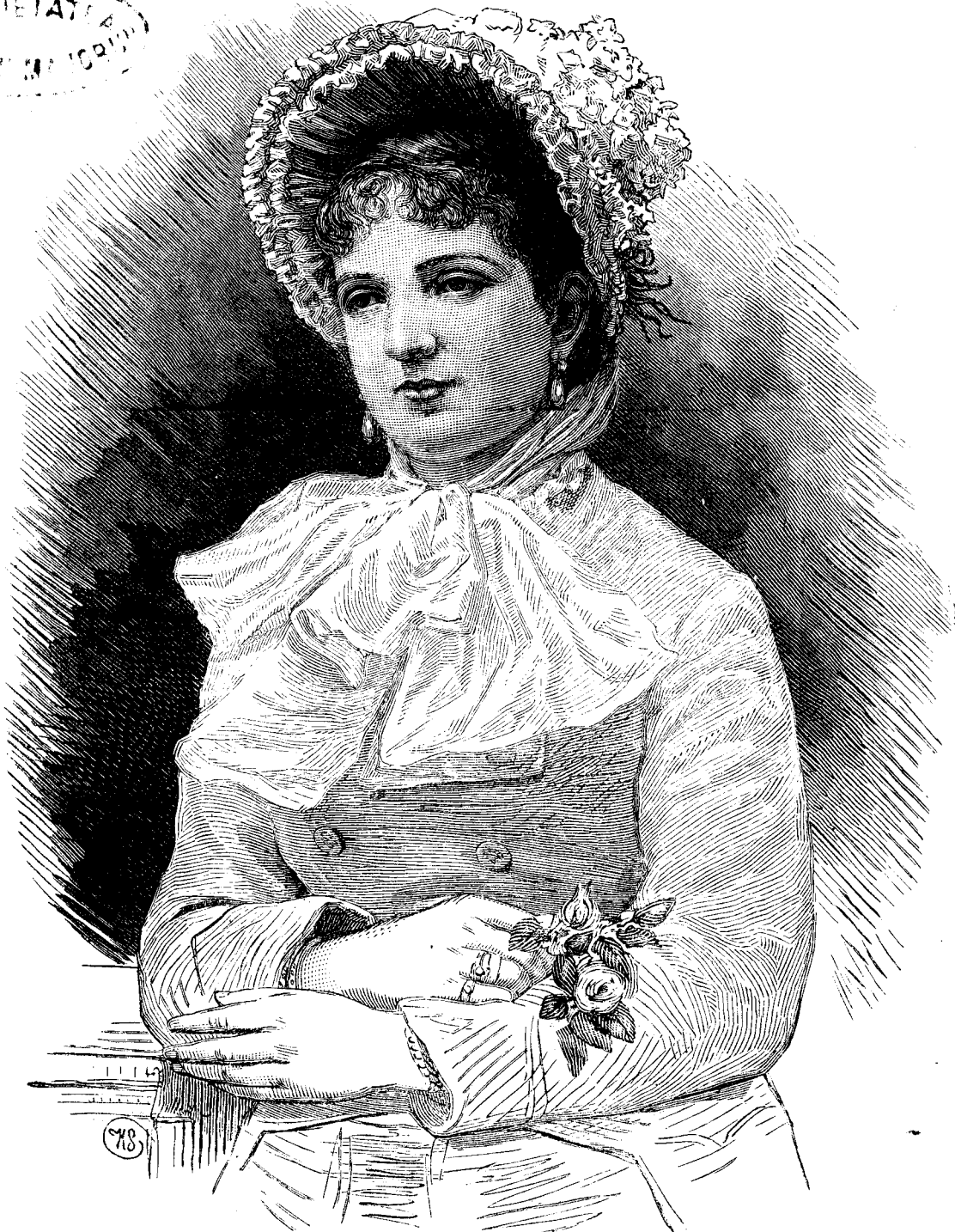
Margaret'a regin'a Italiei.