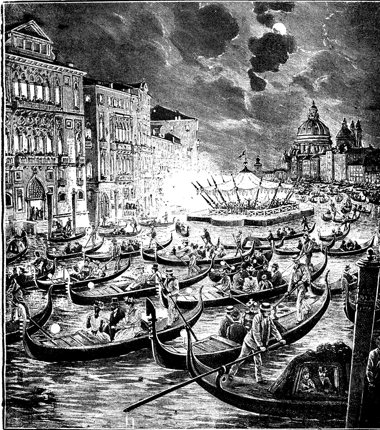
N O P T E V E N E T I A N Ă .