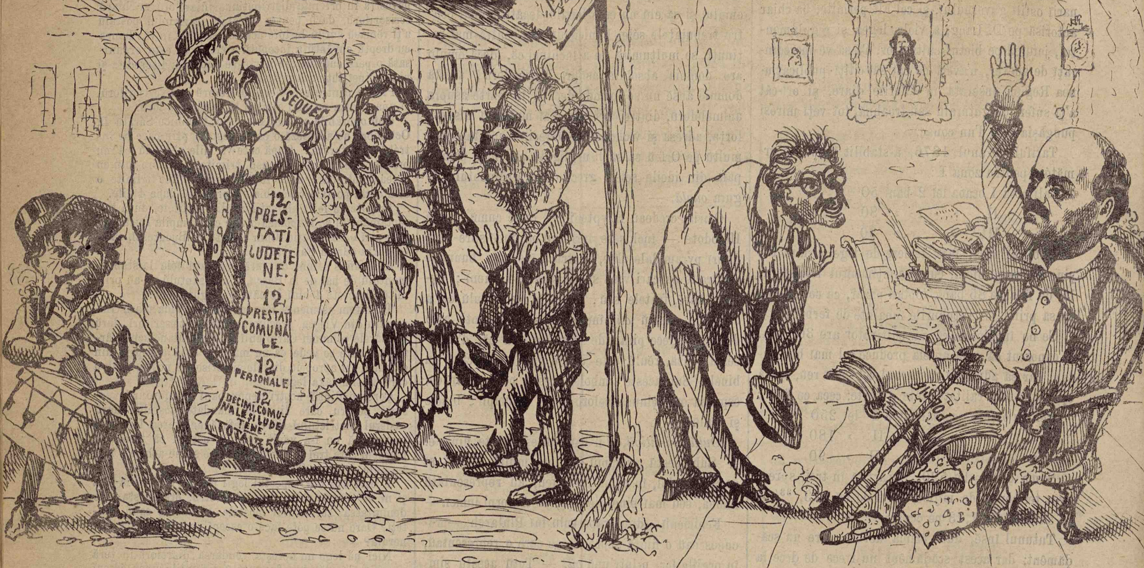
Săracul îi bate toba pentru dări; éra celui ce ridică mâna în sala chemaţilor, i se umileşte. Ast-fel este legalitatea regimului.