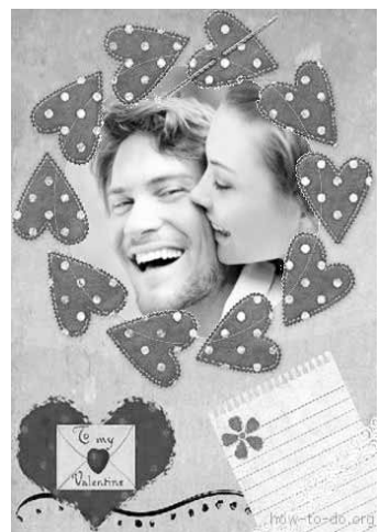
Вибір фотоархіву емоційну фотографію, яка найповніше передає ваші почуття, та приклейте її зі зворотньої сторони валентинки.

До того ж у капусті з'являється неприємний присмак і запах (гіркота, затухлість), відбувається її ослизнення і гниття. У верхньому шарі, який межує з повітрям, особливо, якщо він хоча б нетривалий час залишається без росолу, квашена капуста починає темніти і у неї змінюється смак. Тому побурілий шар капусти