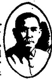
總理遺囑 余致力國民革命

命凡四十年其目的在求中國之自由平等積四十年之經驗深知欲達到此目的必須喚起民眾及聯合世界上以平等待我之民族共同奮鬥 現在革命尚未成功凡我同志務須依照余所著建國方略建國大綱三民主義及第一次全國代表大會宣言繼續努力以求貫徹最近主張開國民會議及廢除不平等條約尤須於最短期間促其實現是所至囑