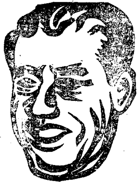
美 國 總 統 特 使 威 爾 基 林 德 同

美國羅斯福總統特別代表威爾基氏，此次東來，除赴蘇聯與近東外，並到中國聘問一周。威氏此行負有說明美國團結一致爭取勝利的決心，及促進美國與同盟國家間的團結合作的兩重使命，歷史的意義，非常重大！