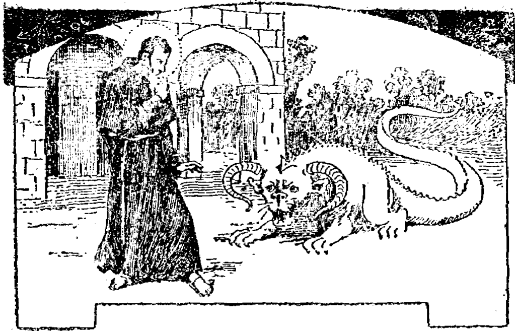
。人聖迫威形獸藉鬼魔

至晚膳的時候；膳後再回到小堂裡祈禱至半夜，又念本分經，末了才躺在一張簡陋的小牀上，略略休息一下。