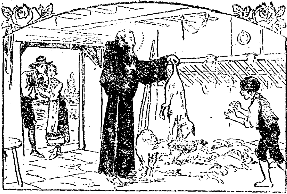
他拉着羊兒的尾巴說：醒來吧

「你遠離修院和衆神昆而獨處，又怎能渡生呢！」不過只有一個地方，就是地獄。「我委實不願往那裡去，因為在那裡是不能愛天主的。」後來他受了熱情的衝動，更補足一句說：「雖然我下了地獄，但我仍願愛我的天主，盼望着祂偉大的仁慈！」聖人對天主的愛情是這樣熾熱，所以天主屢次使他神遊於世外，儼然是個具備肉體的天主公民。