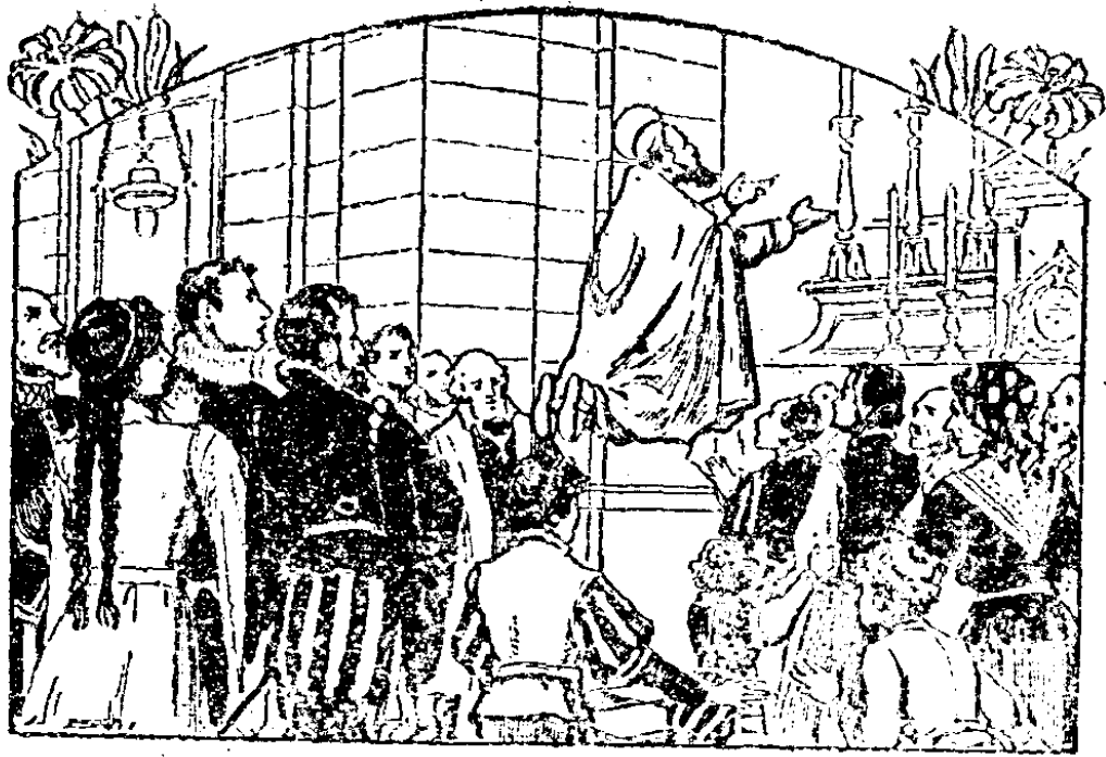
。神出前跟體聖在他

若瑟神父每次在驟然出神的時候，週遭的一切，他常是覺察不到。就是針刺，棒打，刀割……種種足可刺痛肉身的東西，他也沒有覺到。可是祇要有尊長的聲音，便足夠使他從神妙的夢鄉裡醒過來。