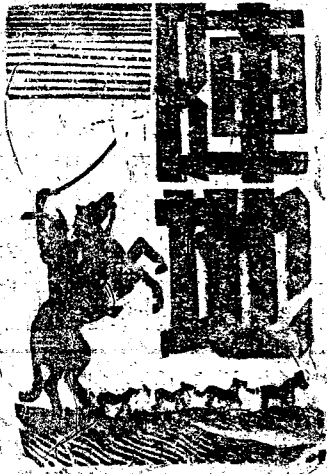
第四九一第版國貴