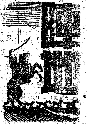
期九八一第版圖畫