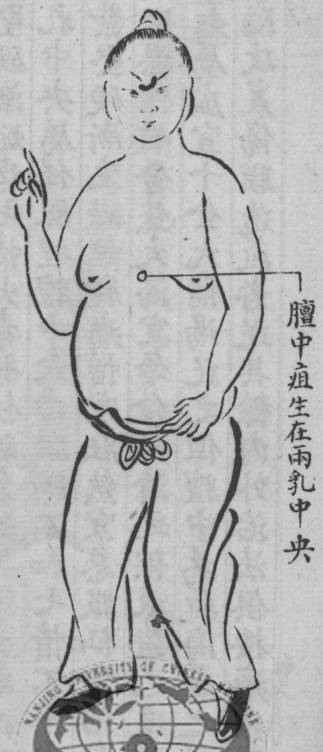
臃中疽生在兩乳中央