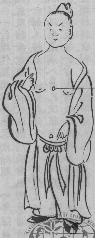
井疽生在心窩中庭穴