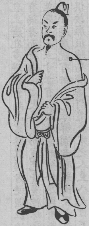
蠱疽生在髑子骨軟陷中