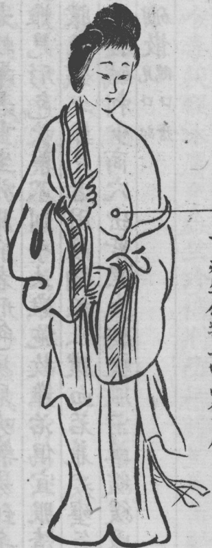
甘疽生在乳上肉高聳處