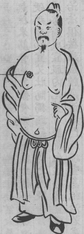
蜂窩疽生在乳房之上形如蜂房