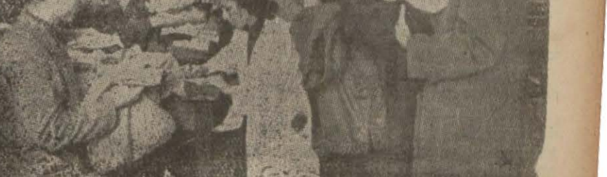
İstanbul üniversitesi de yardım seferberliği yapmaya hazırlanıyor