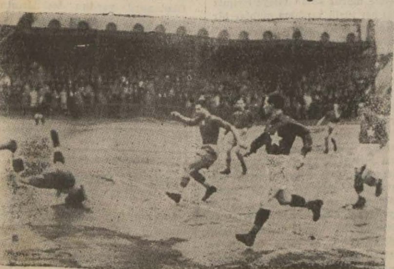
Dünya maçta meşhur Şarışının aygırından çıkan topu Cihat Kaptıyordu. YAZAN 4 İncüde