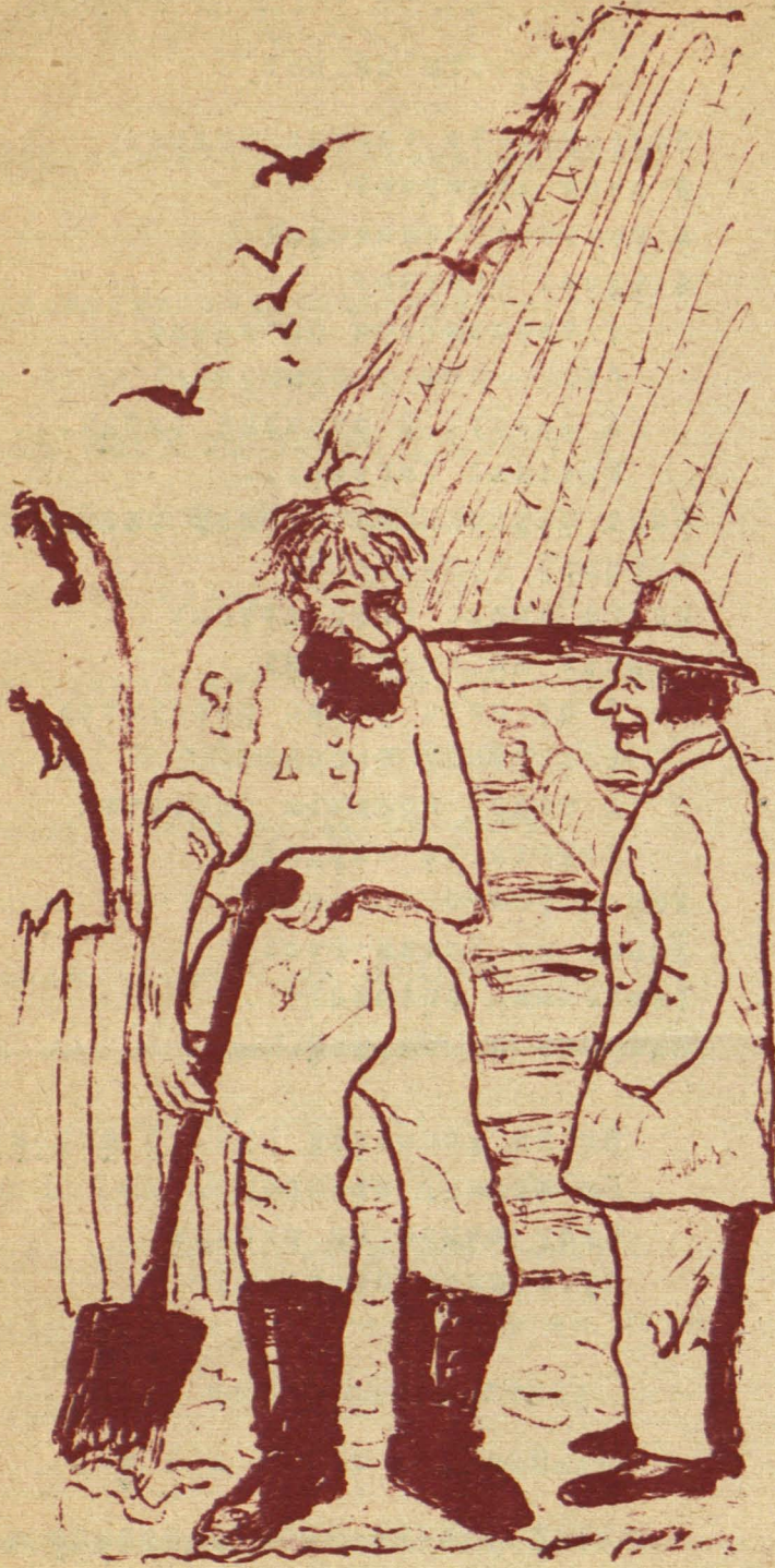
Вучыцель і Трахім.

-Ад душы табе радзіў-бы, Трахім, паставіць пужала, каб пту- шкі ня псулі гародніны.