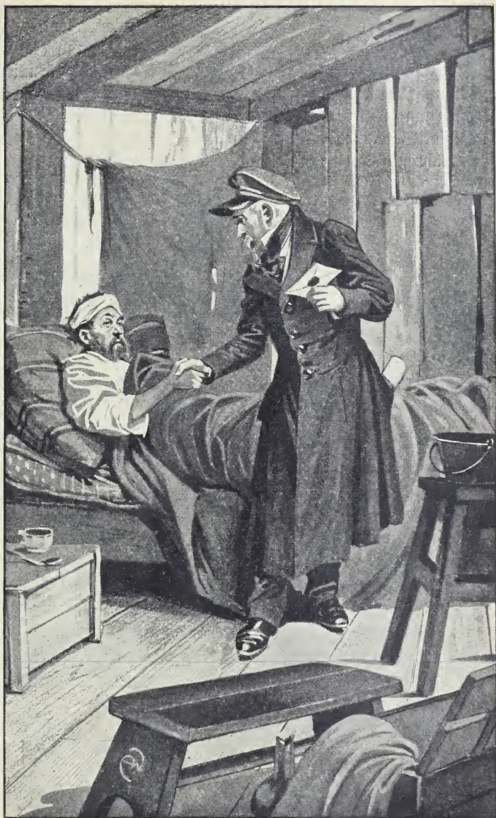
Rappel drückte dem Sterbenden die Hand. (S. 229.)