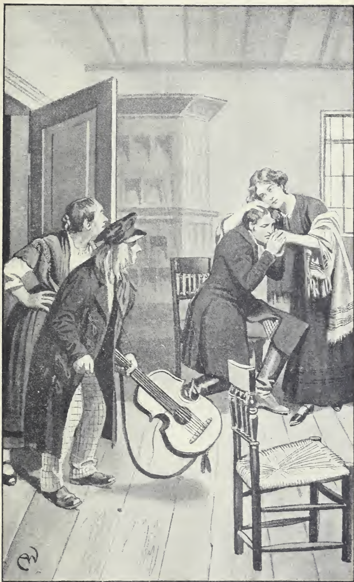
Als Maßlieb ausblühte, gewahrte sie den greisen Komödianten und die Haushälterin in der Thür. (S. 475.)