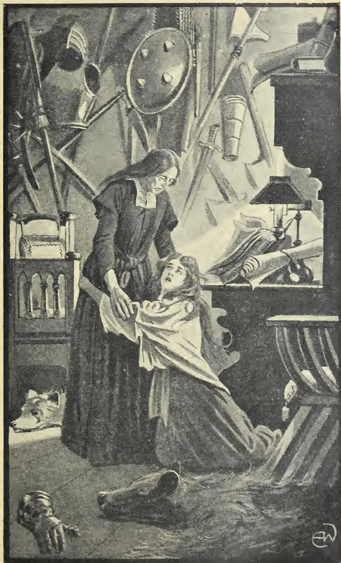
„Steh auf, Kind, und vor allen Dingen fasse dich,“ versetzte Meredith, das zitternde Mädchen mit sanfter Gewalt emporziehend. (S. 51.)