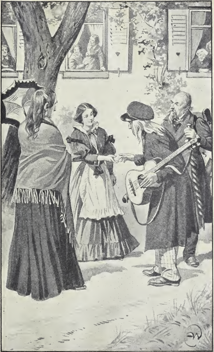
Maßlieb eilte ihren alten Beschützern entgegen und reichte ihnen mit einem süßen Lächeln die Hände. (S. 374.)