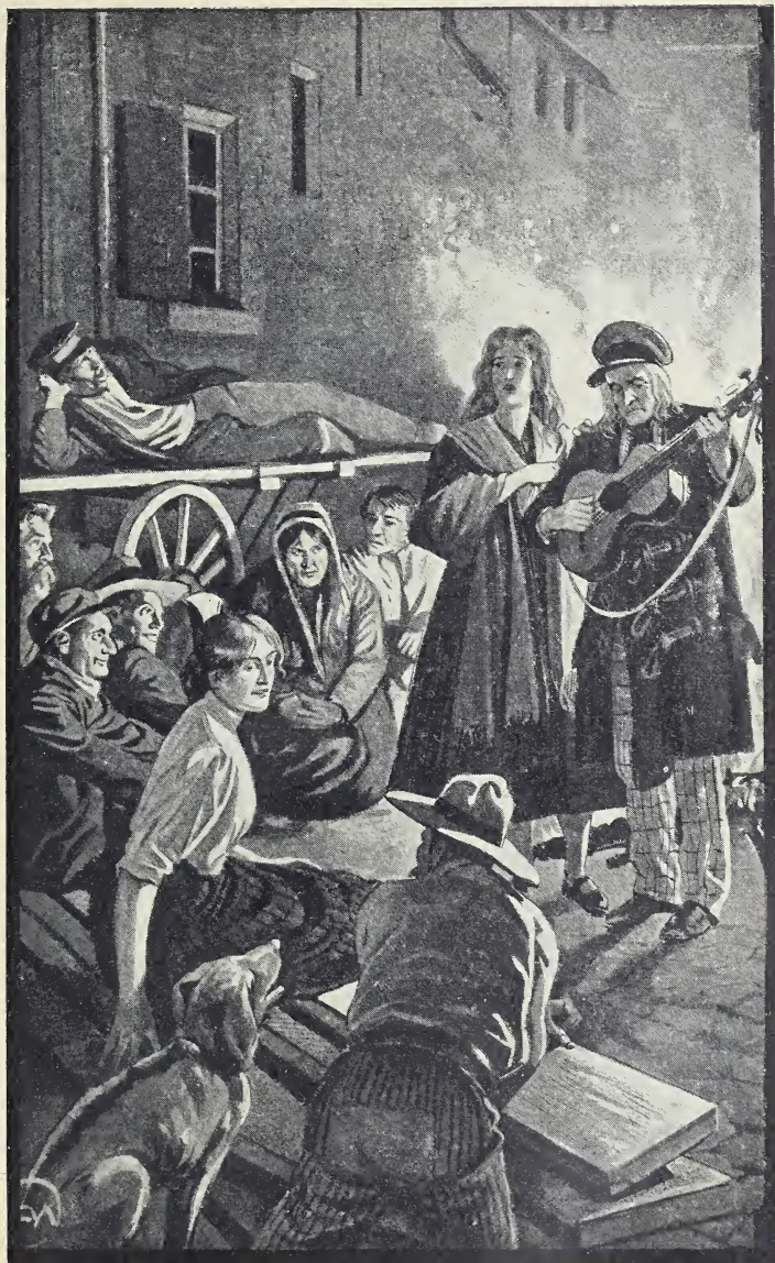
Hell und klar erklang das allen bekannte Lied über den Hof: Fern im Süd das schöne Spanien. (S. 104.)