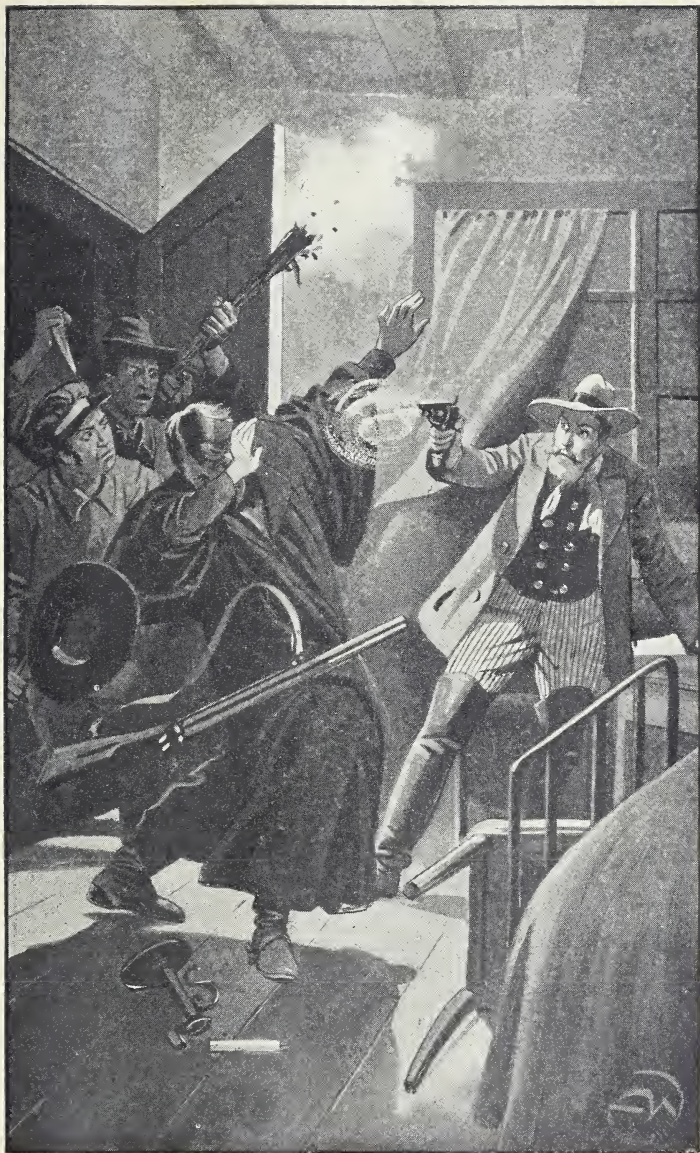
Von Ellenboroughs Kugel durch den Kopf getroffen, brach er lautlos zusammen. (S. 350.)