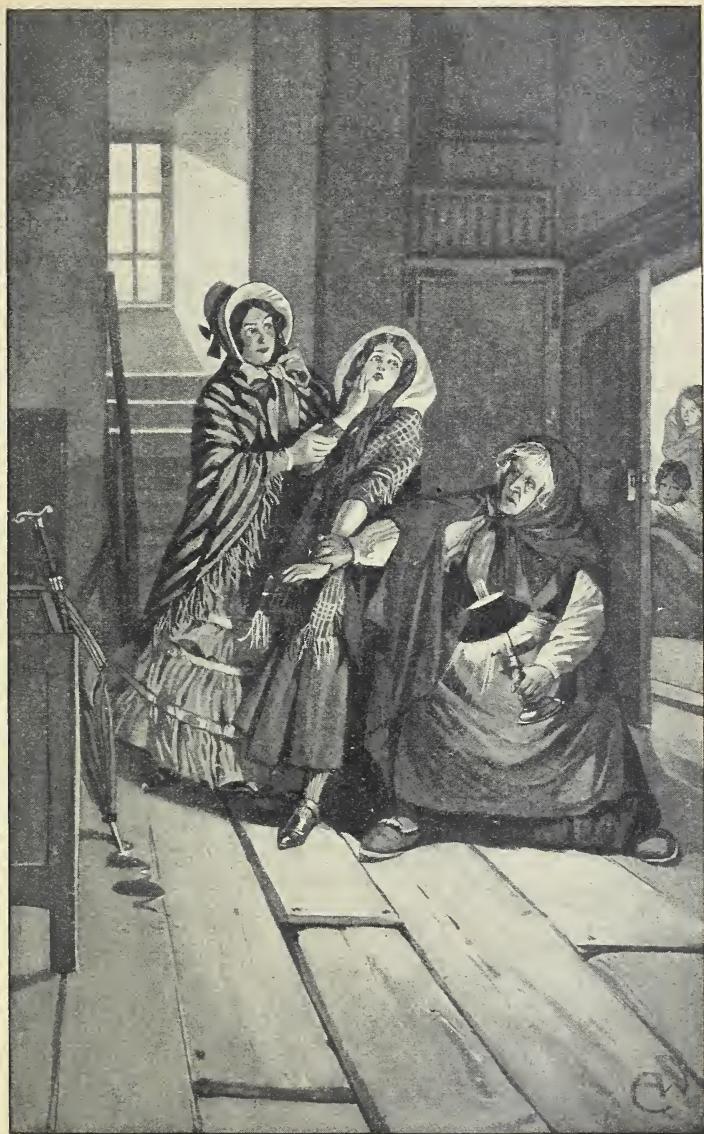
„Laßt mich hinaus“, flehte Maßlieb entsetzt. (S. 171.)