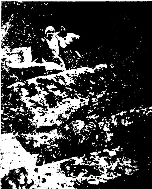
Tasy Iechak Sangarinin (kajsy keltirdi bijin Chazarlarnyn torasyña Moszenin) zeretlerinde Czuff-Kalenin.