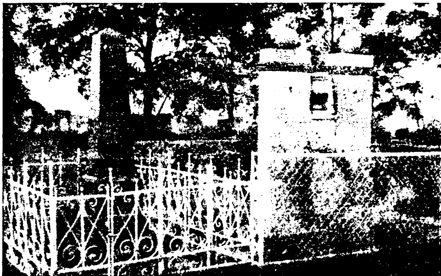
Zeret Luckada (fragment)