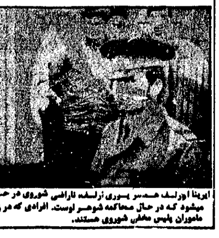
اینجا اورلف همسور سوری زلفه ناراضی شوروی در حال ورود به دادگستری دیده می‌شود که در حال محاکمه شوهر لوست. افرادی که در زمینه همکاری با دشمنان محاکمه می‌شوند.

مسکو - روتنر - وزیر ارشد دانشمند فیزیک ستاره‌شناس شوروی که به اتهام همکاری با دشمنان محاکمه شده است، در جریان محاکمه خود مدعی شد که در زمان جنگ با دشمنان همکاری نداشته است.