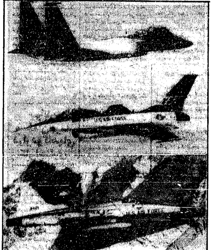
نمونههایی از هواپیماهای ۱۶۶، ۱۶۵، ۱۶۴ و ۱۶۳ که دولت امریکا قصد دارد به اسرائیل، عربستان سعودی و مصر بفروشد. سنای امریکا هم اکنون در حال بررسی این طرح است.

واشنگتن - آوسیتدپرس - سنای ایالات متحده امروز طرحی برای فروش صحرای جنوبی اسرائیل، مصر و عربستان تصویب کرد. سنای ایالات متحده امروز طرحی برای فروش صحرای جنوبی اسرائیل، مصر و عربستان تصویب کرد.