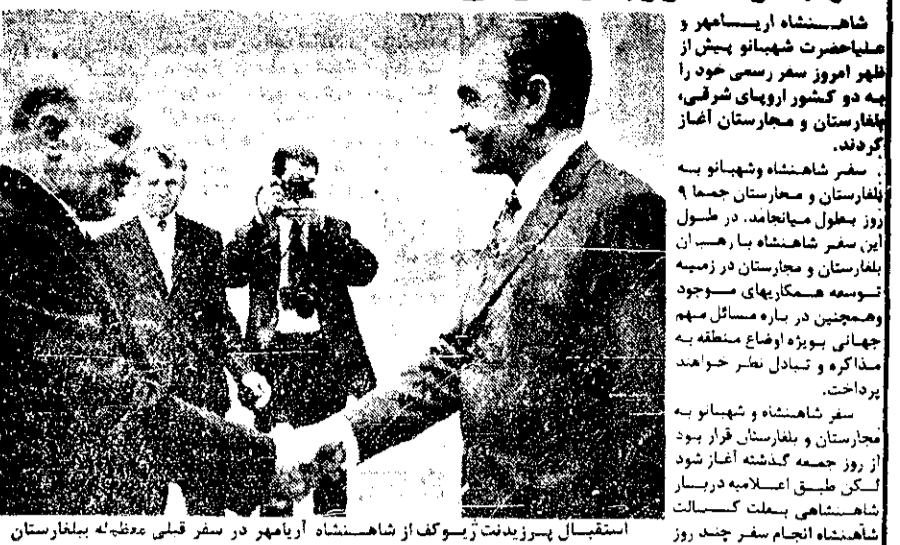
شاهنشاه و شهبانو در استقبال پسرزیدمت زسوف از شاهنشاه آریامهر در سفر قلمی معظله بیلارستان...