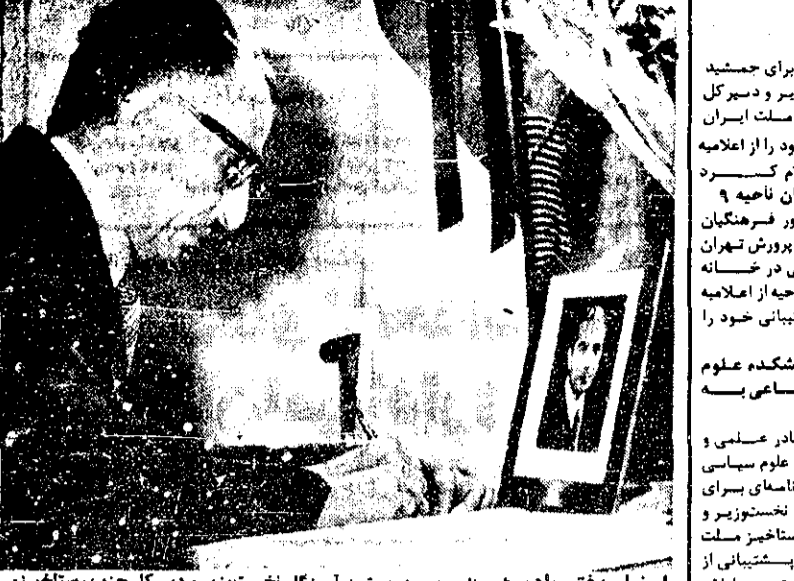
اعضای دفتر یادبود - ظهر دیروز جمشید آدوزگار نخست‌وزیر و دبیر کل حزب رستاخیز در سفارت ایتالیا حضور یافت و دفتر یادبود والدین و والدین موروثی نخست‌وزیر پیشین و رئیس سابق حزب دمکرات مسیحی ایتالیا را اهداء کرد.