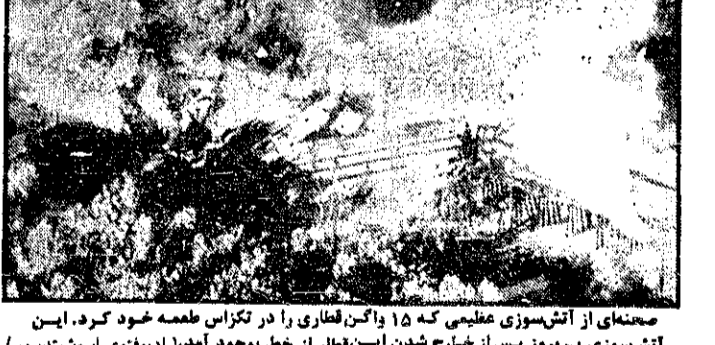
صحنه‌ای از آتشسوزی عظیمی که ۱۵ واگن قطاری را در تکران طعمه خود کرد. این آتشسوزی پریروز پس از خارج شدن این قطار از خط بوجود آمد.

بیت المقدس - روتنر سازمان رسمی بازرسی آوسیتدپرس گزارش سالانه خود را در ۱۰۳ صفحه منتشر کرد. روتنر سازمان رسمی بازرسی آوسیتدپرس گزارش سالانه خود را در ۱۰۳ صفحه منتشر کرد.