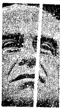
پیام لوتیچ لوتکو رهبر حزب کمونیست ایتالیا به منحل شده حزب منحل شده در ایران

پیام حزب کمونیست ایتالیا به حزب منحل شده از فوتبال ایران