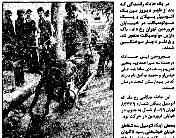
موتورسیکلت پس از انفجار

تاسکی بو، بقصد کتک به را کتک، موتورسیکلت به طرف او دویدند که ناگهان با یک موتورسیکلت برخورد کرد. موتورسیکلت با صدای مهیب منجر شد و آنها را مجروح کرد. مجروحان، توسط تکنیسینهای