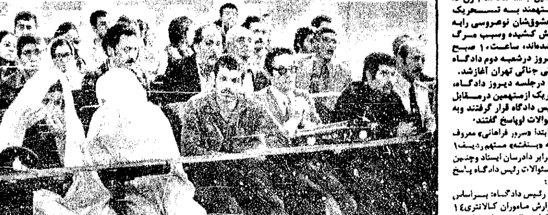
متهمان در دادگاه، امیری با وکیل مدافعشان و سایر زندان دیده میشوند

دومین جلسه محاکمه ۴ زن مستهجن به تسمیریک مصحقیان نوجوسی رایبه آتش کشیده و سوزی مرگ اوشده‌اند، ساعت ۱ صبح دیروز در شعبه دوم دادگاه عالی جنایتی تهران آغاز شد. در جلسه دیروز دادگاه هر یک از متهمین در مقابل رئیس دادگاه قرار گرفتند و به سوالات او پاسخ گفتند. ابتدا «سرور» فریاد «مروغ» به «سخته» متهم زدیم. در برابر دادرسان ایستاد و چنین به سوالات رئیس دادگاه پاسخ داد: «مروغ» و «سخته» متهم زدیم. در برابر دادرسان ایستاد و چنین به سوالات رئیس دادگاه پاسخ داد.