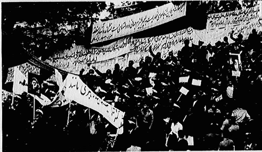
جنگل مشت های خلق در برابر جاسوسخانه آمریکا

در این مبارزه همسکین و سر نوشت از زمین و نوری نامتعداد یک ای قدرت و یک ملت کوچک، مایه روز خواجه بود. یک شرط، یک شرط بسیار مهم و حیاتی آن است که اجتماع نیروی نوین، اجتماع خلق توده رهیبر واحد امام از آگاهی، انسجام، بهینش و طاقبت و شعور انقلابی بهره مند باشد، اگر همه نیرو های انقلابی دست به دست هم دهند داخلی را از وجود مزدوران دشمن پاک کنند و رستوران پنج آن ضربات مهلکی وارد آورند، اگر اهرام اقتصاد جامعه را از دست سرمایه داران لالای سفت خارج ساخته بدست رهیبری انقلابی و توده های کارگر سپاریم اگر عوامل مرتجع سازشکار و منافقان و فرست طلیان را نرود خلق رسوا و از صفوف انقلابیون خارج کنیم، اگر ارتش و سازمان های دولتی را از عناصر نامطوایب و فساد و منافسبت استبدادی و استعماری پاک کنیم، تازی و واکی اتحاد اقوام مختلف را با دادن حق تعیین سر نوشت در چارچوب ایران آزاد و انقلاب اسلامی تأمین کنیم و هر چه در توان داریم بر او عمل کنیم در کردستان با پانچوم، اگر با پای ما که بهای فوری را، دهقانان صاحب زمین و کشت خود سازیم نیروهای آنها را آزاد کرد خدمت انقلاب و بازسازی کشاورزی کشور بکار گیریم، اگر با خلق به اندازه سرمایه داری و البته و خرافات، هم اقتصاد کشور را مستقل و کارگران را از قبود استعمار آزاد سازیم، اگر شوروی انقلاب با نیروی ملی در دست و به وحدت و انسجام در پیش پیش متکسبی و شیوه عمل انقلابی دست یابد و با بر نه های خود، طاقبت لازم را در اجرای طرح های انقلابی