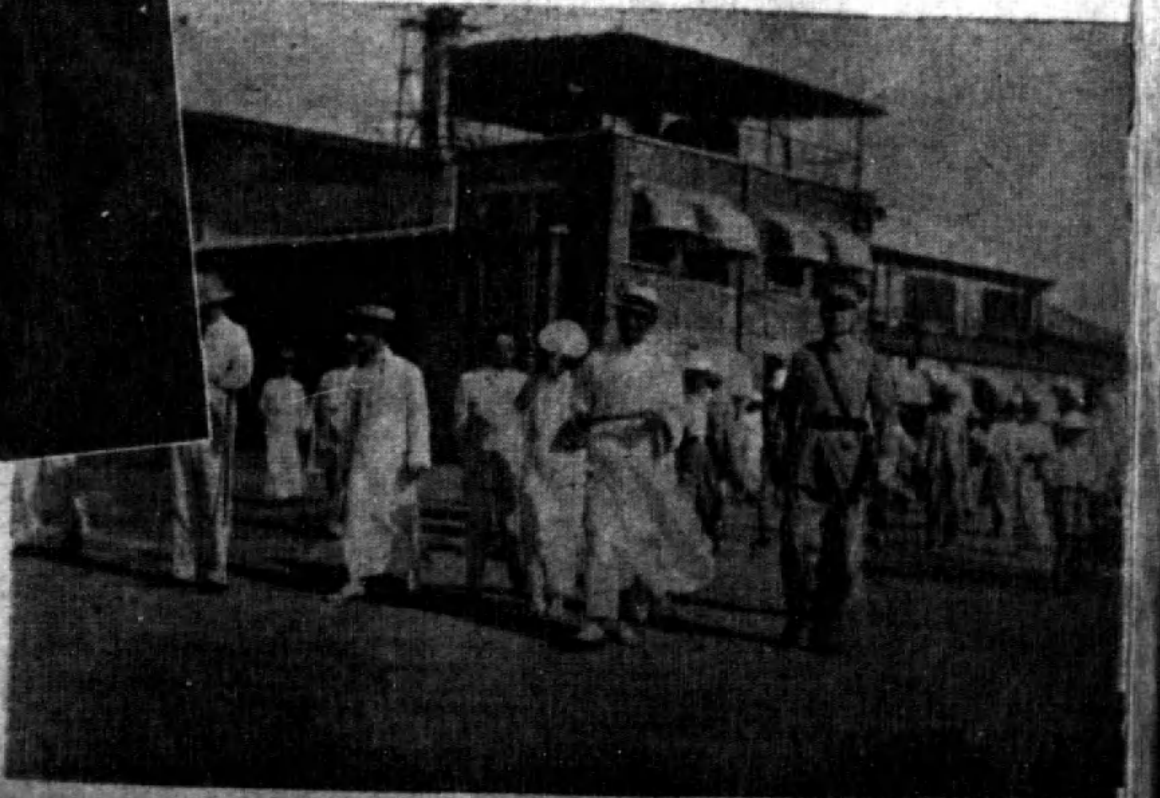
(四)赴粵指導 黨務之陳 立夫視察 司法之居 正由滬乘 機飛粵