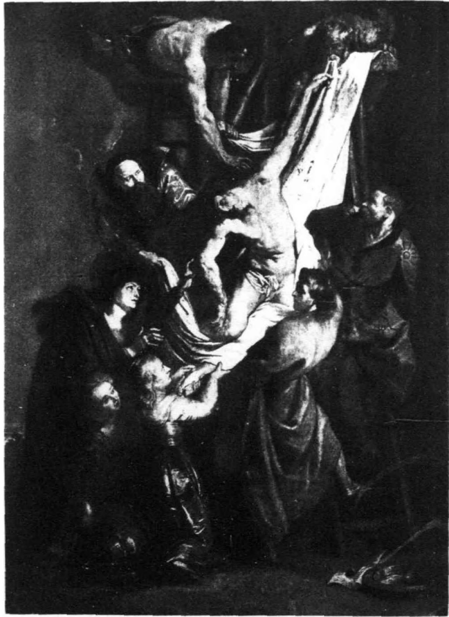
耶穌從十字架：被取下