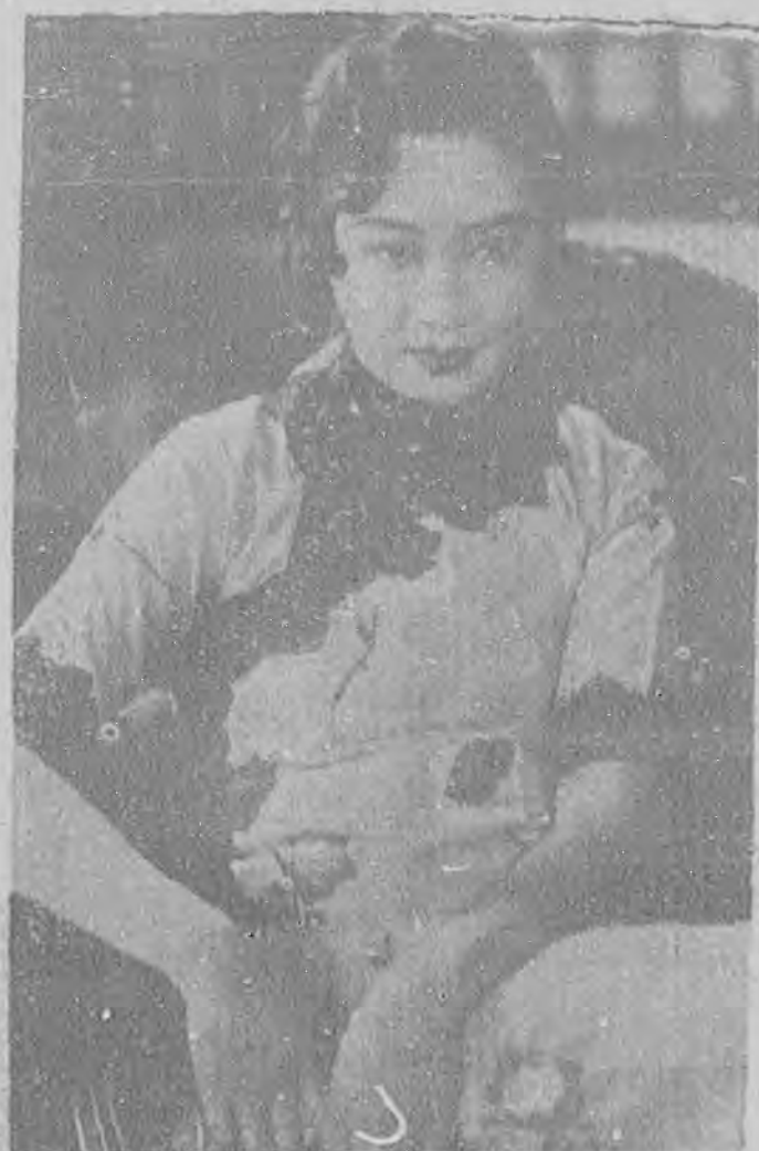
婚後的胡蝶傾軋庭攝

「小明珠」是沙麗澄波的新作品，快要在本市真光影院上映了，全劇富於諷刺的趣味，劇很生動，沙麗的表演，依然很高漲可愛，很可惜在片中，對白插進許多侮辱我國的話，有一段沙麗同一個長人跳舞，她說怎樣勇敢，用一把刀可以捉住三個中國人，又有一段是守燈塔者人對沙麗講，勸她將來不要到野蠻的中國去，又說中國有許多海盜，這些話本來與劇情毫無關聯，不知道爲什麼要硬插進去，徒然增加世界人士對於中國的惡印象，真不知福克斯公司是何居心？聞中央電檢會對於此片，將派員澈查此事，按外片侮辱我國之事層出不窮，雖然政府也辦過這種交涉，但是效果很少，我們希望觀衆應該對於屬華影片，拒絕觀看，警告影戲禁演此類影片，同時要督促政府認真和外片公司，以拒絕的傷外片在中國放映爲抵抗辦法，才會使外片公司知所警交涉，