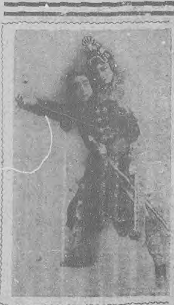
(巧酒之芳世幸草盛葉)

僕是個立在舊藝術旗幟下的人，雖不能說是個信徒，但是早就麻醉的昏沉了。舊戲之於今日，雖然有些人對牠表示同情與信仰，然而一般舊禮教統治下的先生和遺老們，仍然是刁難牠，說牠卑污下流的罵個不休，恰人這個名詞，幾乎成了人格破產，社會上再找不出牠的立場來，其實說句公道話，拿藝術來換錢，正是自食其力，可有什麼可恥的呢，不過，過去的事實，恰人把自己的身分看得太輕，自願供人戲耍，免不了遭些物議，試看現在的趨勢，和梨園的變遷，比較以往提高到甚麼程度了呢，明眼人自不待言，就會了解的，在現在這種情形下，要和樂於斯道者未參考討論牠，一切辱罵譏笑，我們認為是無意識的舉動，不來管他，我行我素何必又要旁人同情呢！並且附帶聲明的，不才對於劇學本沒有什麼造詣，不過與之所至，總要發洩只希望大家肯其來指導斧正，那我就榮幸多多了！