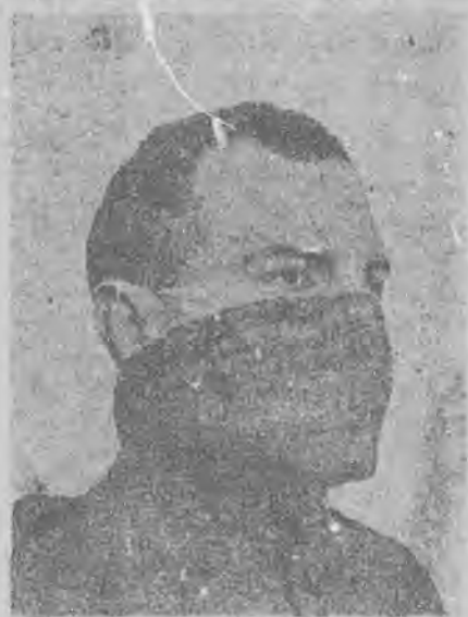
散佈毒氣時應備之 預防之紗套

一層藥棉，與另一層藥棉之間隔一層木炭粉。其置五六層，外用一條紗布，捆於口鼻上，(見圖)這樣即可防備意外之需了，(上面的藥品在化學藥品材料店可以買到，如同義德，三和儀器公司等)