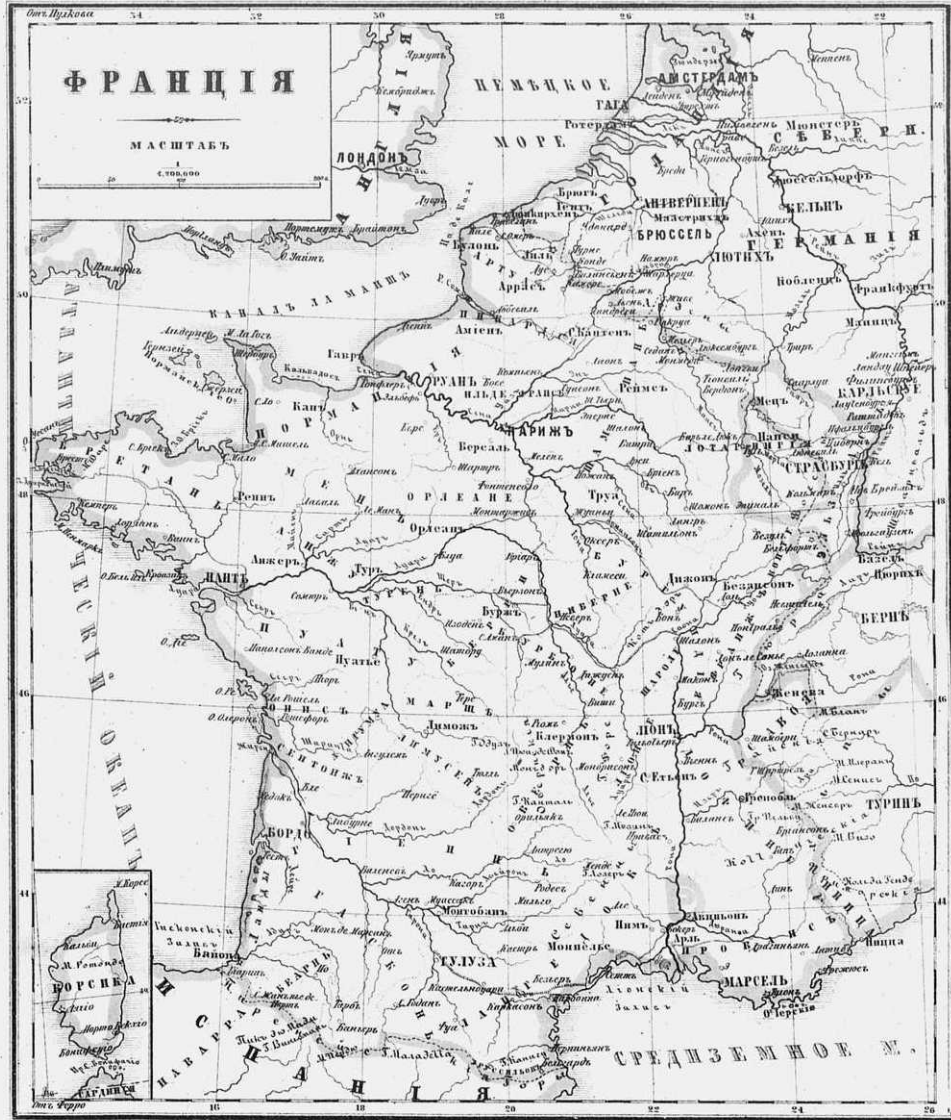
Географическая карта Франции по Ватеру ир. 1842 г.