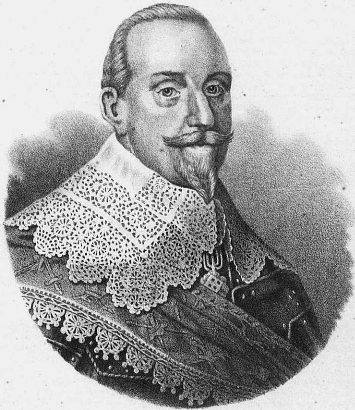
ГУСТАВЪ II АДЛЬФЪ КОРОЛЬ ШВЕДСКІЙ.

съ портрета, писаннаго Мирефельдомъ, гравированнаго Крузиусомъ и приложеннаго къ нѣмецкому переводу Martini 1760 г. Жизни Густава Адольфа соч. Вальтера Гарте