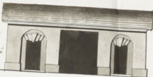
Фасадъ деревяннаго Рабора части III е № 2.