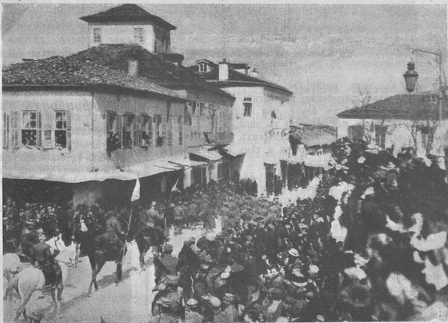
Къ войнѣ на ближнемъ Востоѣ. Въездъ наследнаго принца греческаго въ Янину.

Подобнаго рода эксперименты можно продѣлывать развѣ только въ инертной Персіи; при всякомъ иномъ противникѣ вѣроятно въ результатѣ было бы «крупное дѣло» безнаказаннаго, для насъ безцѣльнаго, истребленія отборныхъ людей отряда, чѣмъ боеспособность послѣдняго была бы подорвана съ мѣста весьма серьезно.