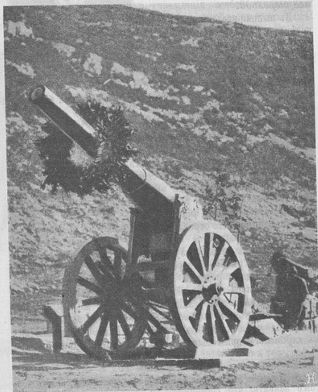
Къ войнѣ на ближнемъ Востокѣ. Греческое осадное орудіе, украшенное лавровымъ вѣнкомъ въ знакъ паденія Янины.

Мнѣ на память приходятъ сейчасъ мои бывшіе преподаватели русскаго языка. Ихъ уже нѣтъ въ живыхъ, и по-