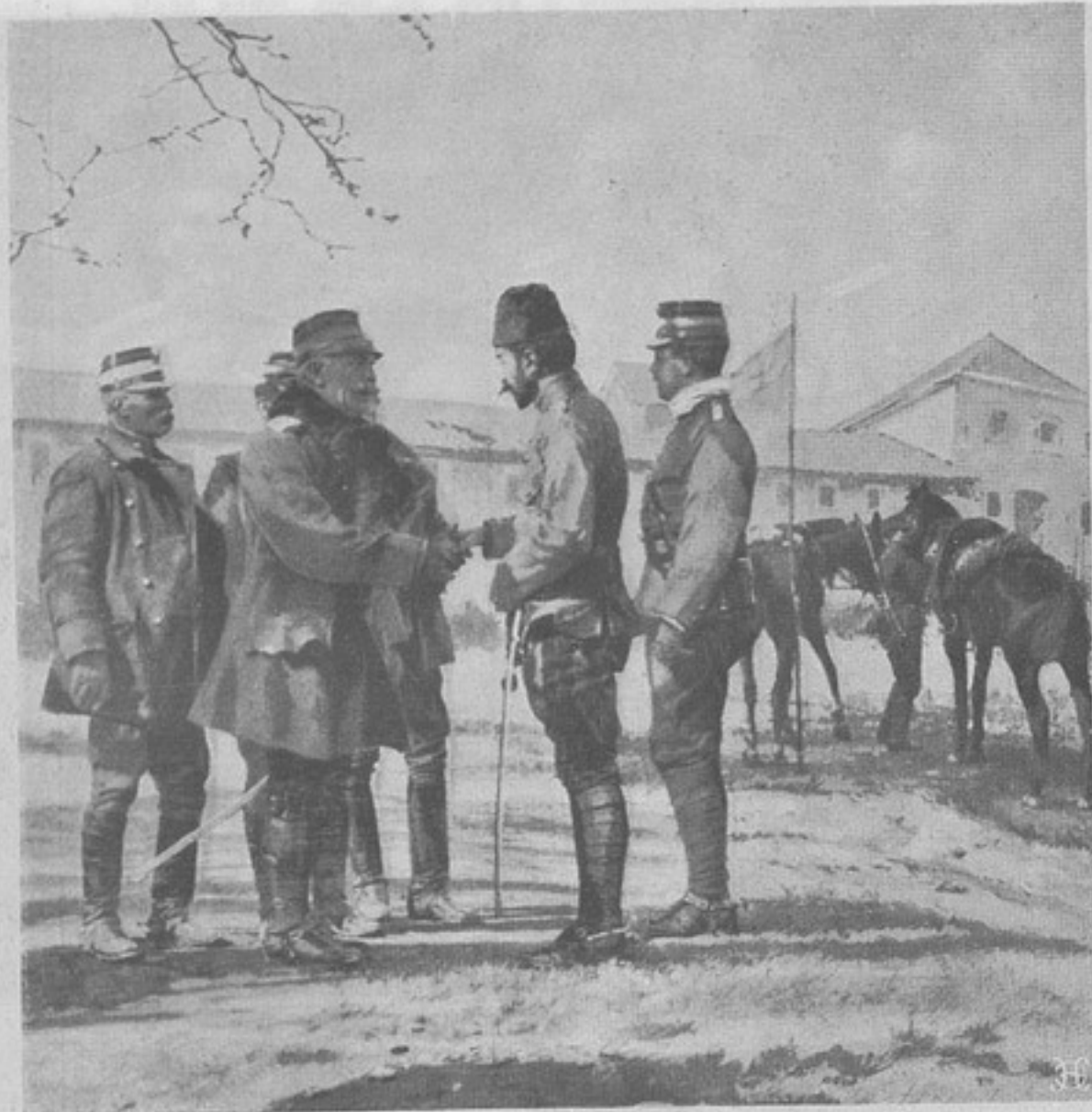
Къ войнѣ на ближнемъ Востокѣ. Эссадъ-паша, сдающій Яниву генералу Сутза.

— Съ удовольствіемъ, — отвѣтилъ Ардатовъ.