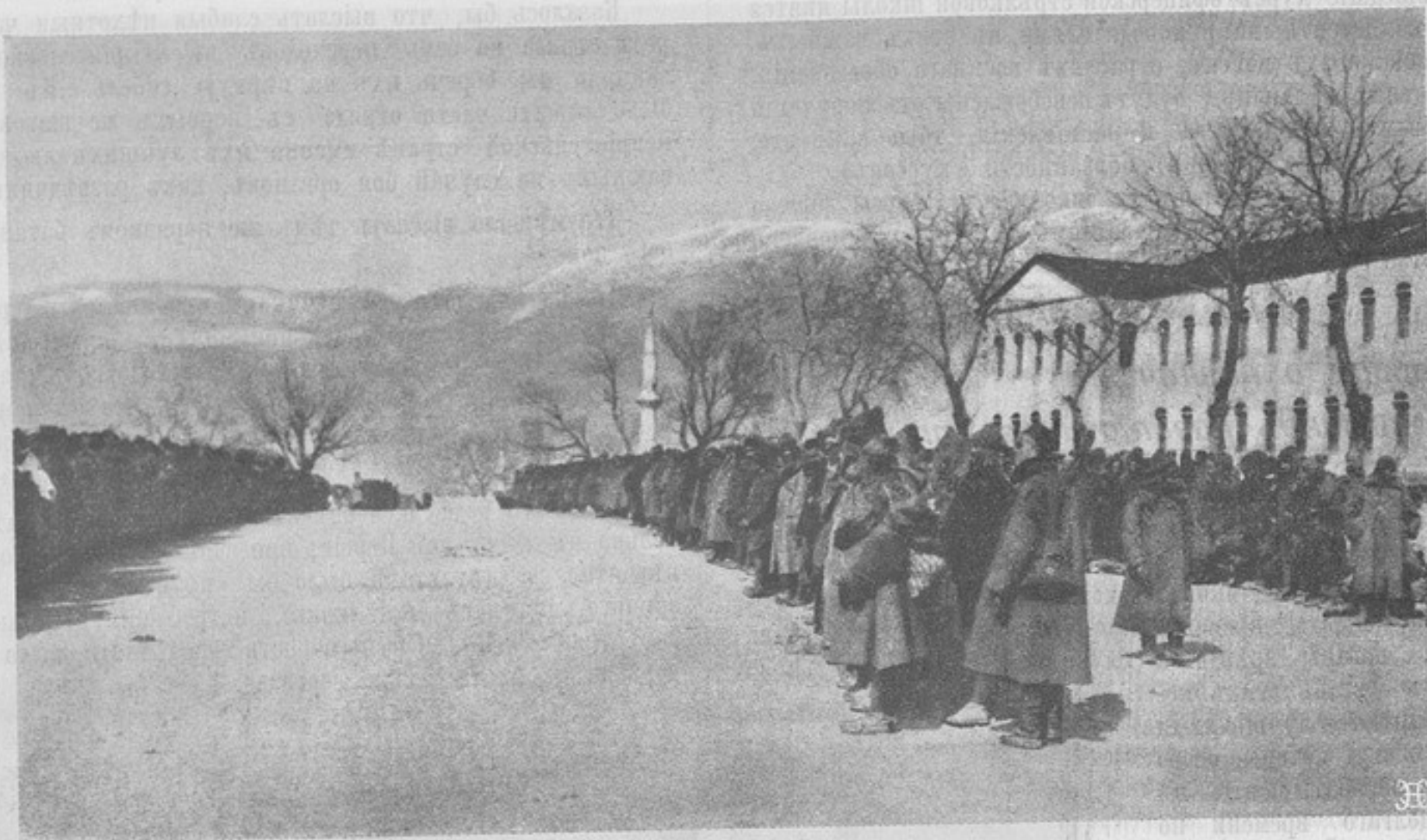
Къ войнѣ на ближнемъ Востокѣ. Турецкія войска, взятыя въ плѣнъ при сдачѣ Янины.

1) если цѣльнымъ выстрѣломъ подобѣть неприятельское орудіе и тѣмъ совершенно прекратить дѣйствіе онаго;