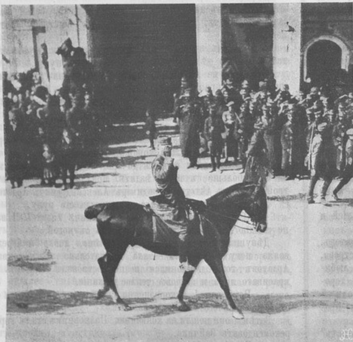
Къ войнѣ на ближнемъ Востокѣ. Наслѣдный принцъ греческій при въѣздѣ въ Яниву.