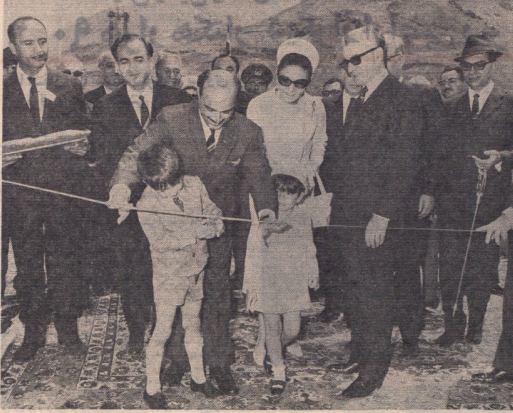
۲۵ اردیبهشت‌ماه ۱۳۴۶ - در پیشگاه شاهنشاه آریامهر و علیاحضرت شهبانوی ایران سد فرحات پهلوی (د محل لتیان) افتتاح شد.