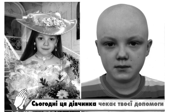
Сьогодні ця дівчинка чекає твоєї допомоги

Трансплантація кісткового мозку в Білорусії коштує 150 тисяч доларів. Самотужки родині таких грошей не назбирати