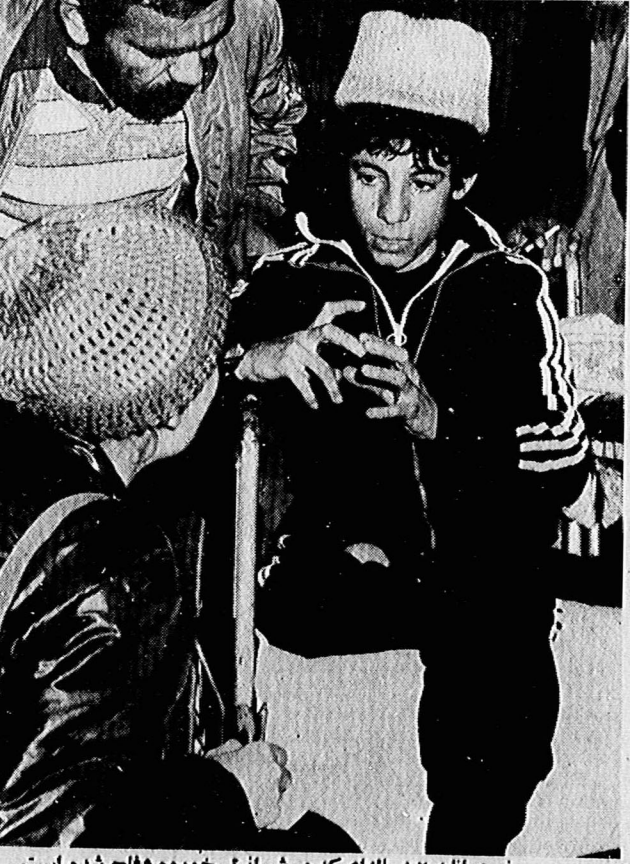
نوجوانان ۱۲ ساله‌ای که در شیراز تیر خورده و کشته شده است