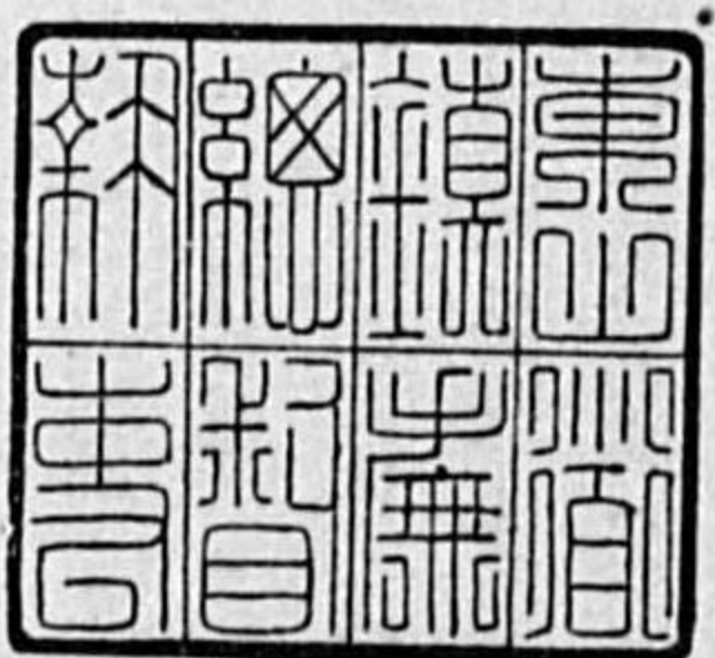
角厘五分八寸一 寸原