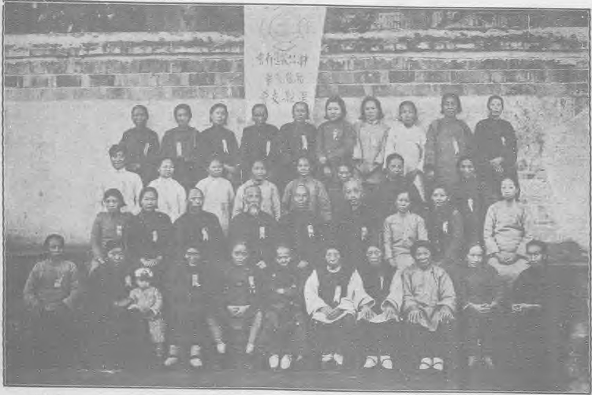
三十三一 日一五九 念紀立成會支堤渡李區教縣萬部女婦會行進教公華中