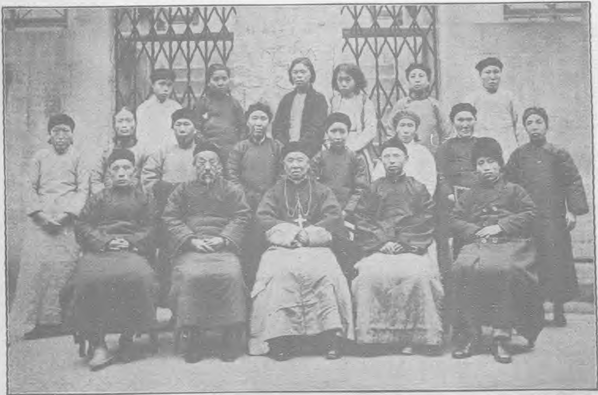
三十一 四二五九 立成念紀會指區縣萬川四部女婦會行進教公華中