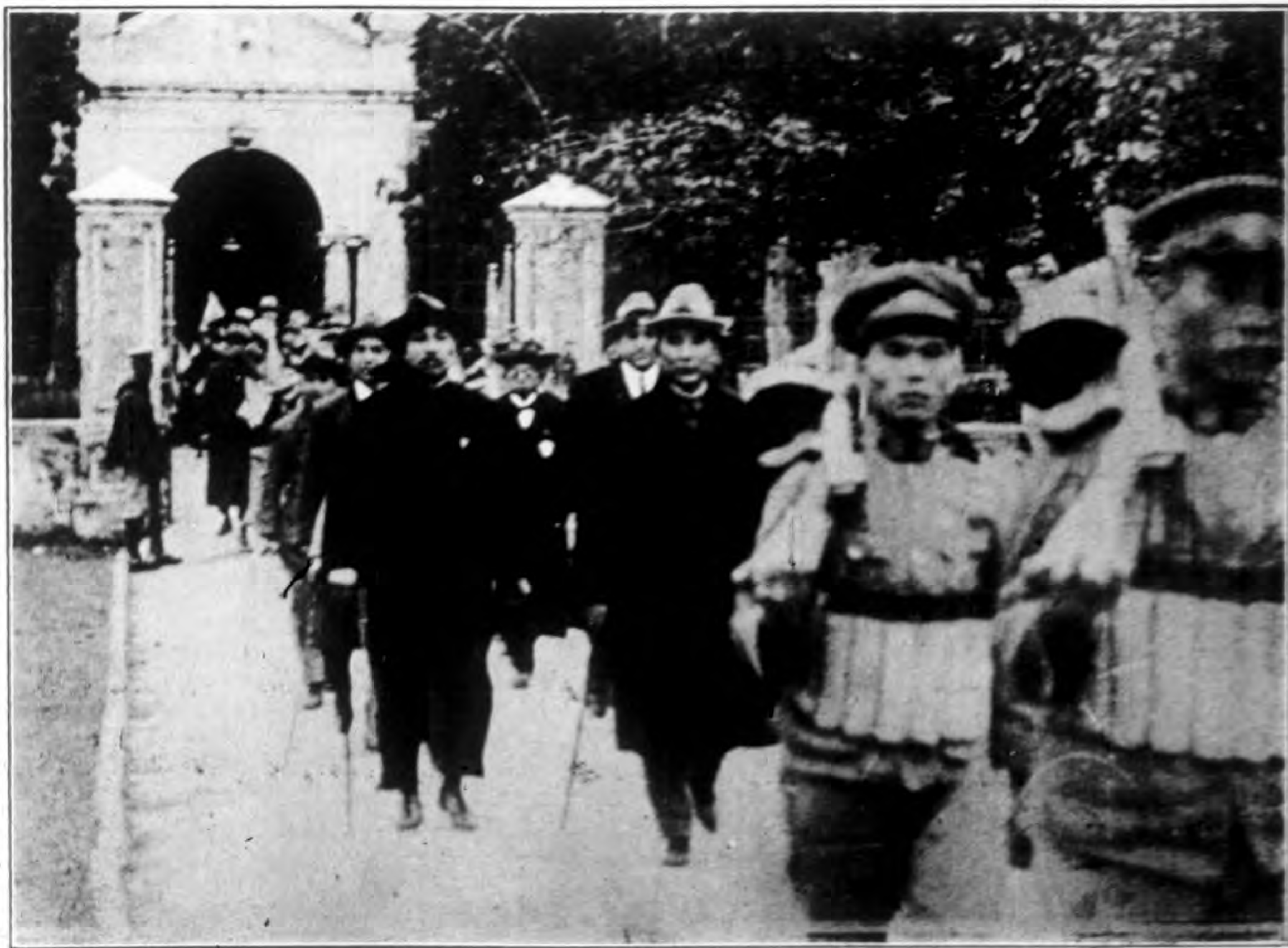
民十三年 總理在第一次全國代表大會會場門前攝影