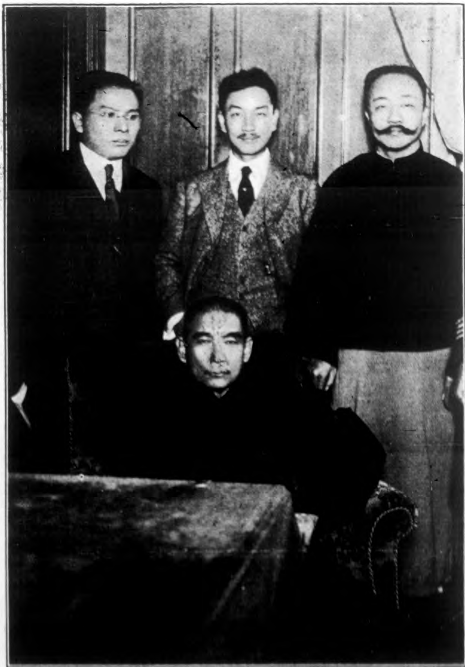
影人等子鈞李季與丸上海時在北總理三年民 合四文宋烈陶戴中海上在北總理三年民