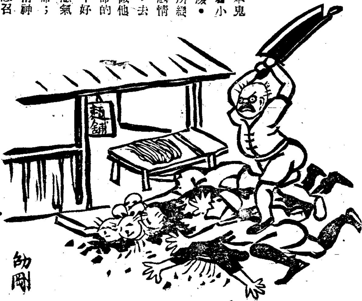
曹頂舉起切麵刀，直取倭寇腦袋的神氣。

這段故事是這樣的：曹頂那個時候，日本鬼子正幹着一種海盜的勾當，名叫倭寇。他們駕着小船，到中國沿海一帶地方，恣淫擄掠，肆意騷擾。有一次，他們像一窩蜂似的，衝到了南通城，所經各處已被他們踐踏得不像樣子了。曹頂看到這般情形，非常氣憤，於是他就奮袂而起，連夜四出，去糾合他的同伴，各自拿起了一把切麵的大刀，做他們唯一的武器，就此呼嘯而出，看見倭寇就拚命的砍，拚命的殺，竟一口氣把萬惡的倭寇，殺掉了好幾百個；替南通被害的同胞，大大的出了一口惡氣！雖然他本人也就在這次的砍殺中，犧牲了性命；可是他的心願痛快了！他的事業成功了！他的精神永遠不死了！事後南通人受了他這偉大精神的感召，差不多沒有一個人不對他感激涕零，表示萬分崇