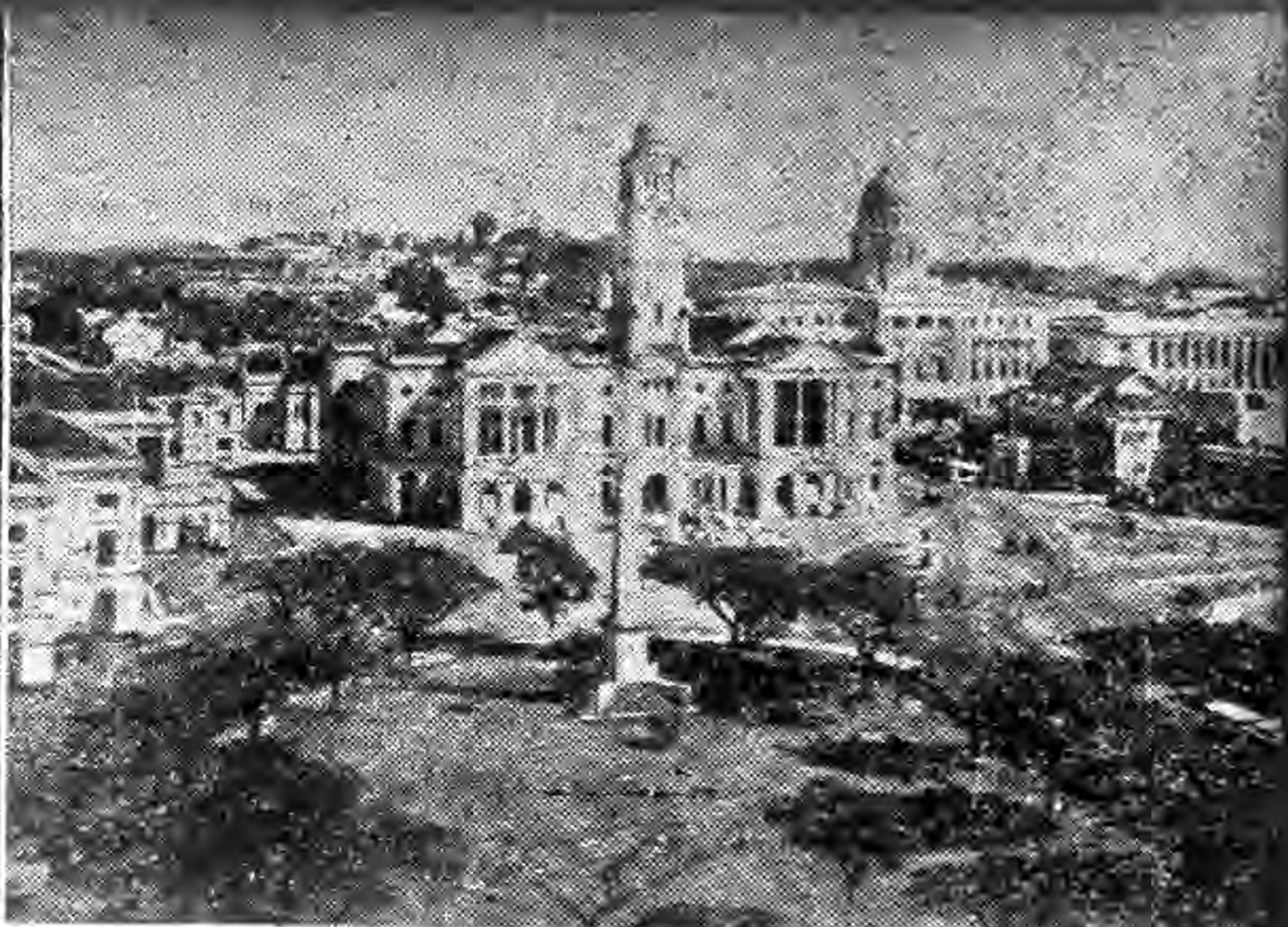
(右一)即將陷落之新加坡 (右二)被日軍俘獲之關島總督馬克木蘭與萊貝利中校 (右三)荷印之兵器廠班頓市 (左一)沿密林向達維奧進攻之日軍 (左二)日軍牛車隊渡河 (左三)日軍乘大象向緬甸進軍 (左四)運抵日海軍部之戰利品