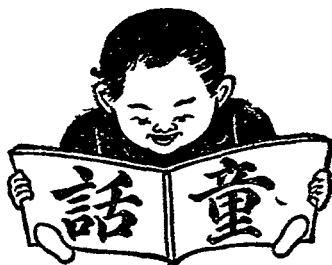
圖 畫 精 美 文 字 淺 顯