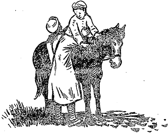
。了去走地的目向，上馬在獸子柱小把