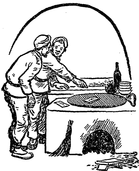
鍋蓋上放着一摺票子