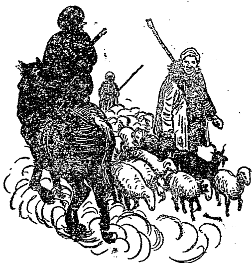
白軍沒有認出劉志丹