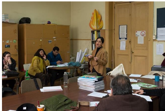
Carlos Figueroa, CC-BY-SA-4.0

Cabe señalar que los contenidos y la modalidad del curso tuvieron que adaptarse al contexto nacional; por lo tanto, para contribuir al buen desarrollo de las actividades curriculares de los docentes, se organizó el programa de la siguiente manera: se centró en las herramientas utilizadas para incorporar el desarrollo de la ciudadanía digital en el aula, se agregó más clases en línea a través de YouTube y se hizo que las entregas programadas fueran más flexibles.