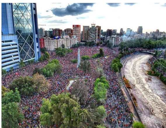
Hugo Morales, CC-BY-SA-4.0

Las imágenes obtenidas bajo esta campaña han servido no solo para ilustrar los diferentes artículos de Wikipedia relacionados con el movimiento social chileno, sino también diferentes artículos de prensa en Chile y en todo el mundo.