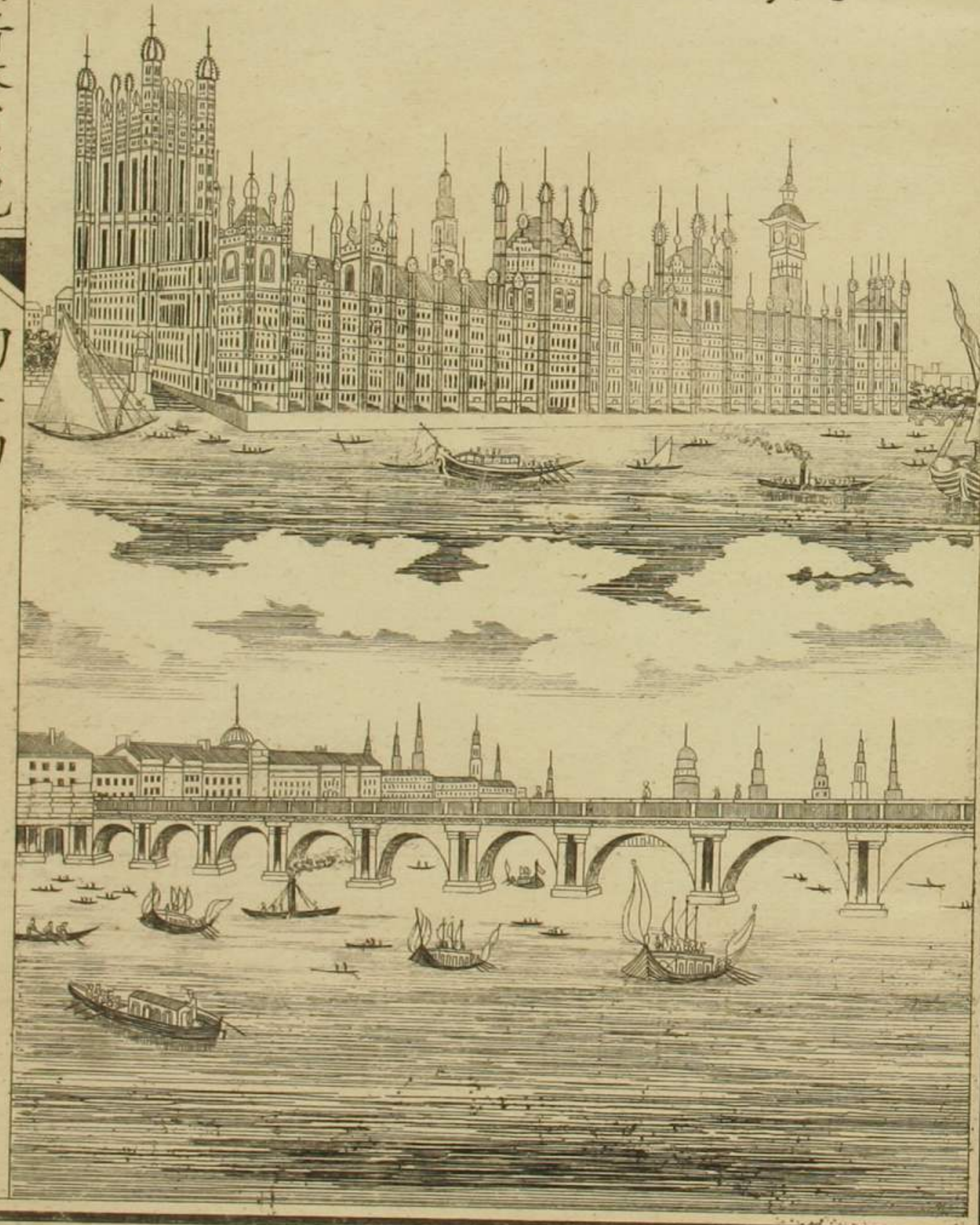
龍動橋及議事院之圖