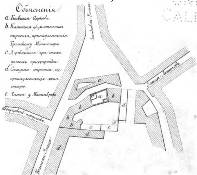
Планъ мѣстности Пятницкой церкви въ г. Вильно.