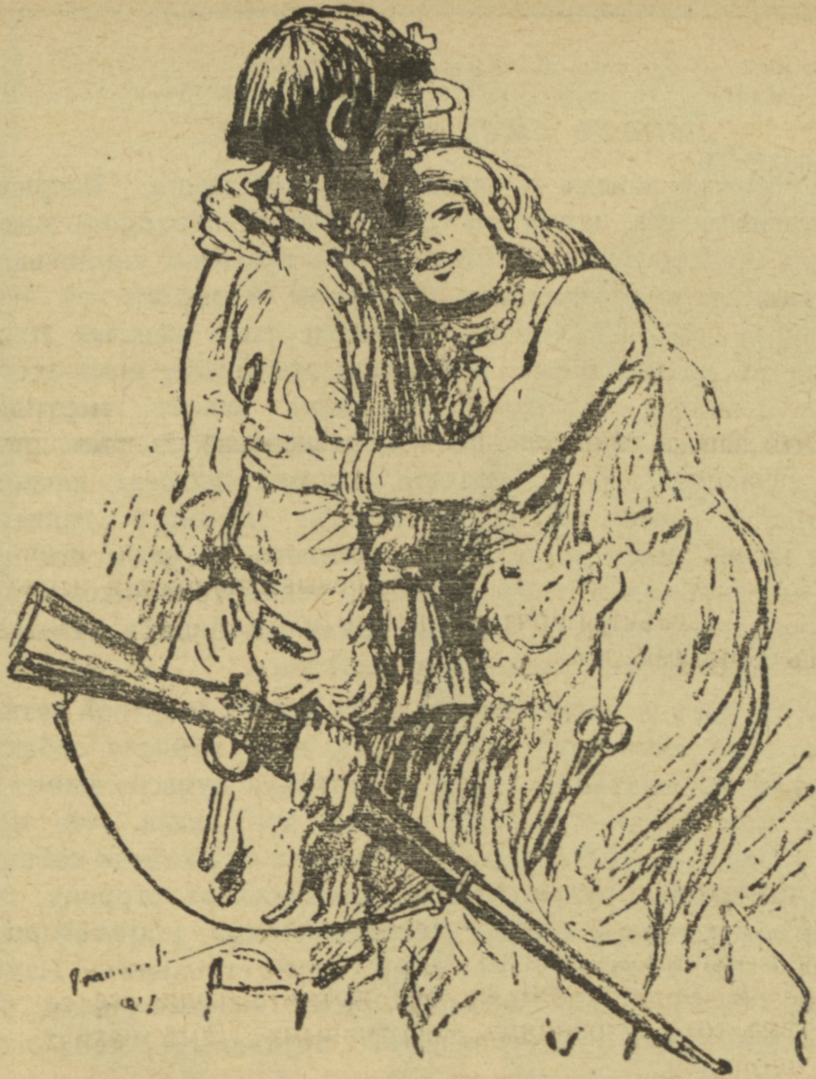
— Славянинъ, остерегайся ласкъ Далилы! (Изъ журнала „Le Rire“.)