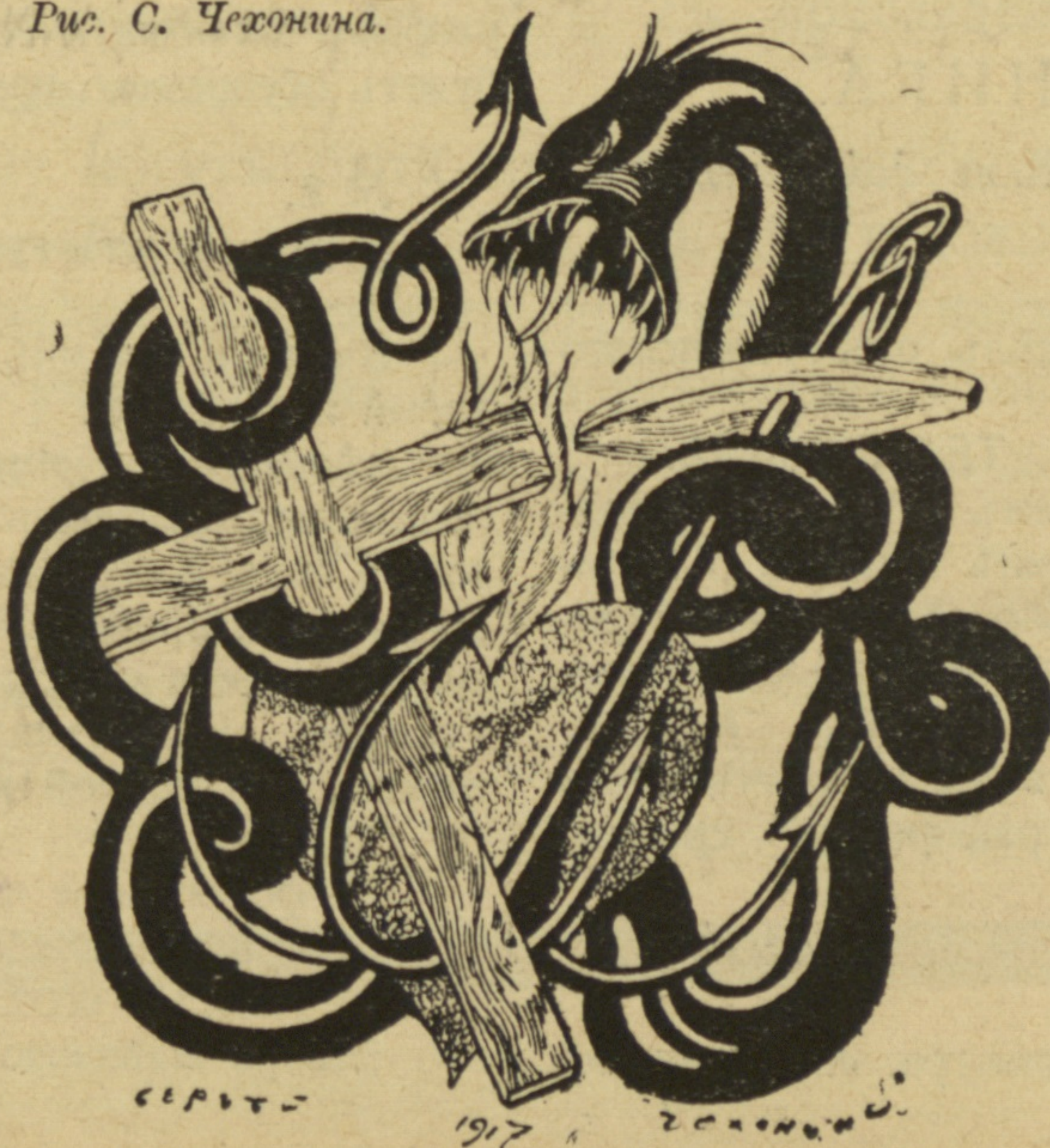
Рис. С. Чехонина.

Взглянула: городъ тюремъ и оградъ. — Ну, ничего, — сказала, — это выжжемъ! И вотъ уже угрюмый Петроградъ На мигъ, на часъ веселымъ сталъ Парижемъ.