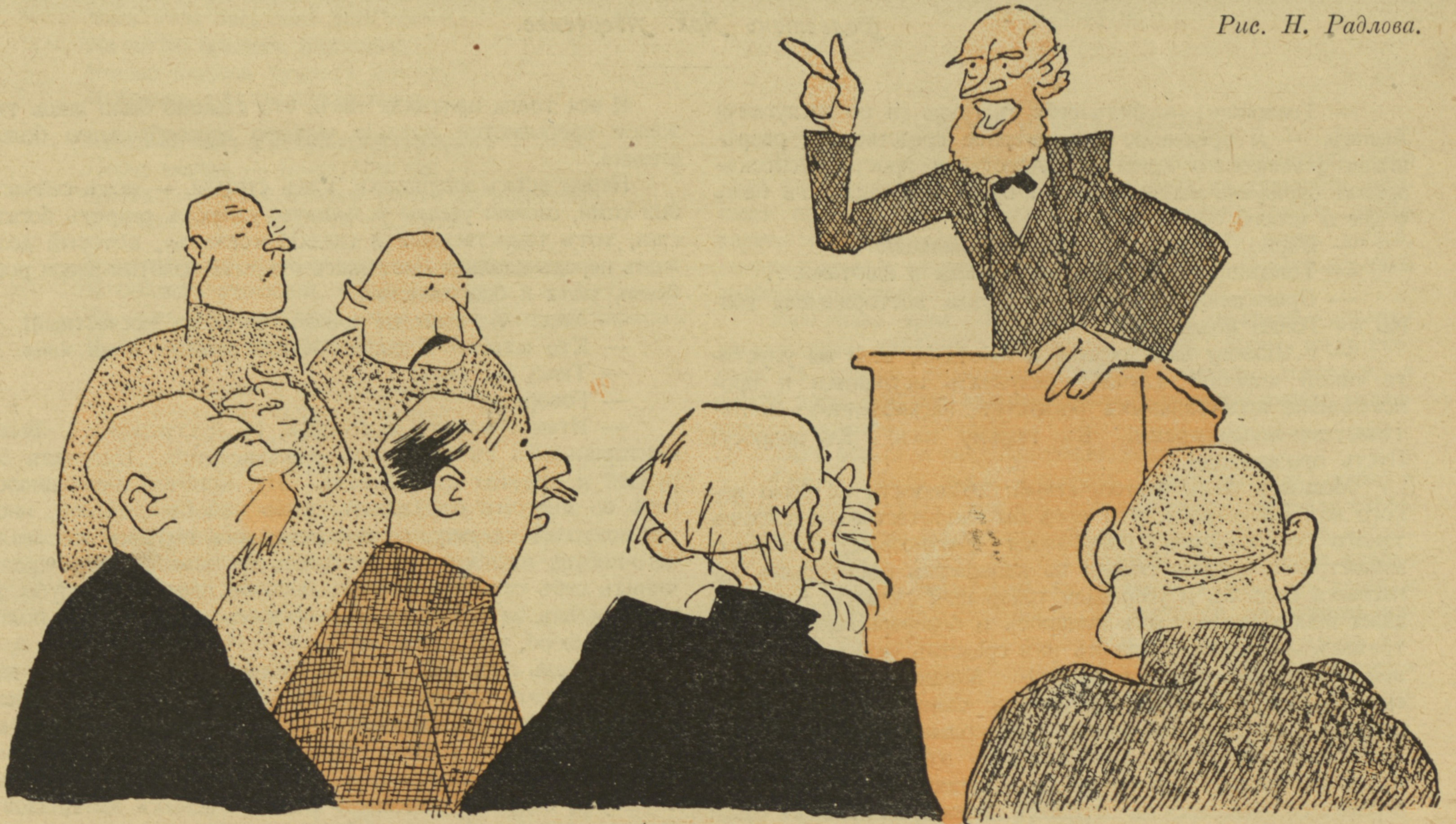
Рис. Н. Радлова.

— Граждане! Именно теперь и настала тотъ моментъ, когда все вино должно быть разъ навсегда уничтожено, и уже есть опредѣленныя свѣдѣнія изъ провинці!..