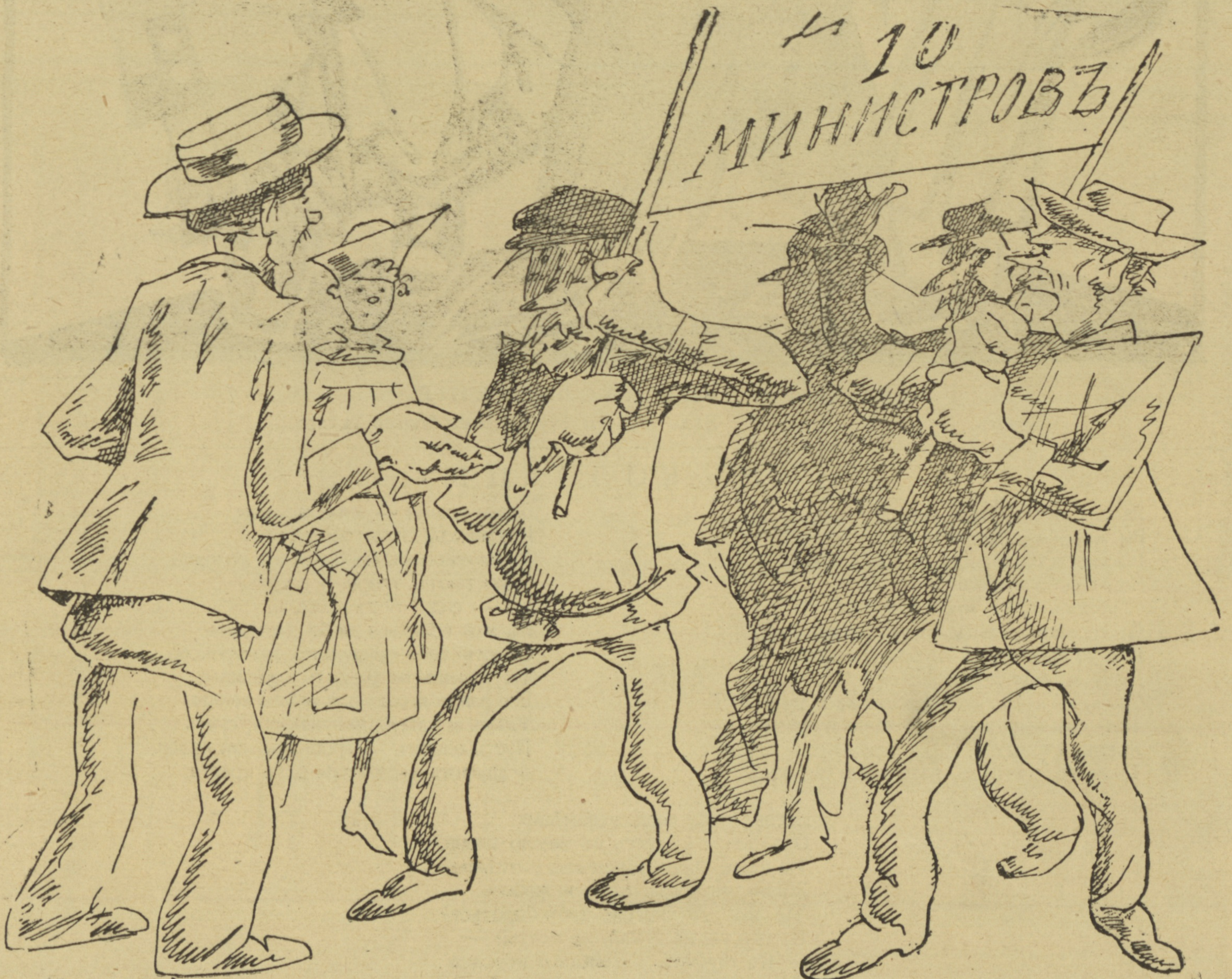
Рис. Н. Радлова.