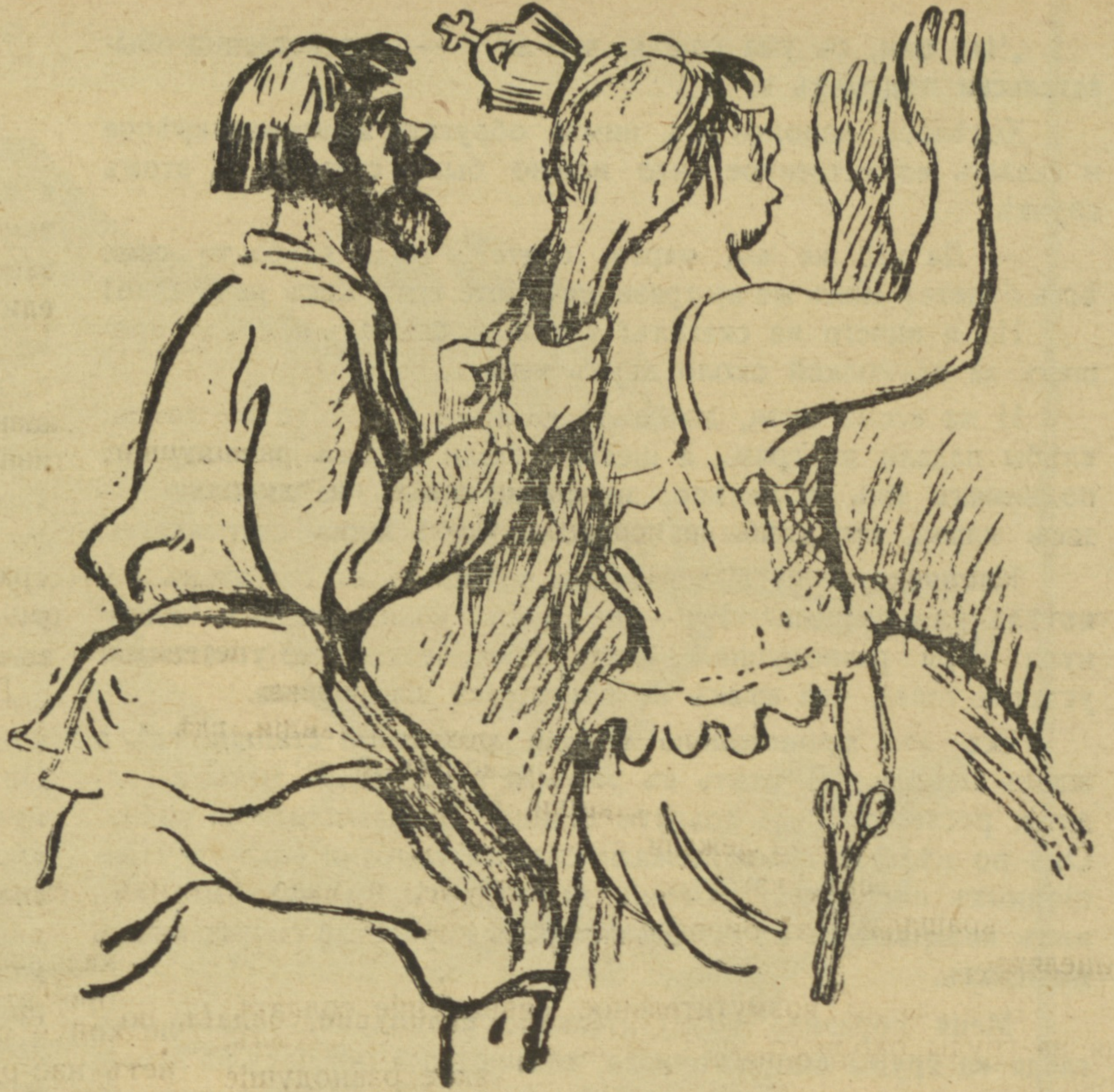
— Онъ остерегается!