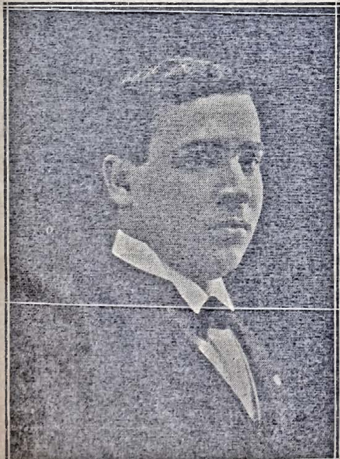
Повисшаваний судія Леонард Сніткін, бувший оборонець в процесі „Свободи“.