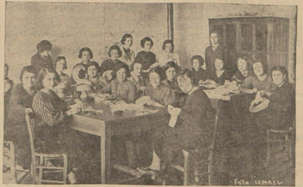
İzmir kız sanat enstitüsünde akşam mektebi talebesi şapkacılık dersinde

Sivrisinek mücadelesi genişletilecek, panayır hazırlıkları ilerliyor