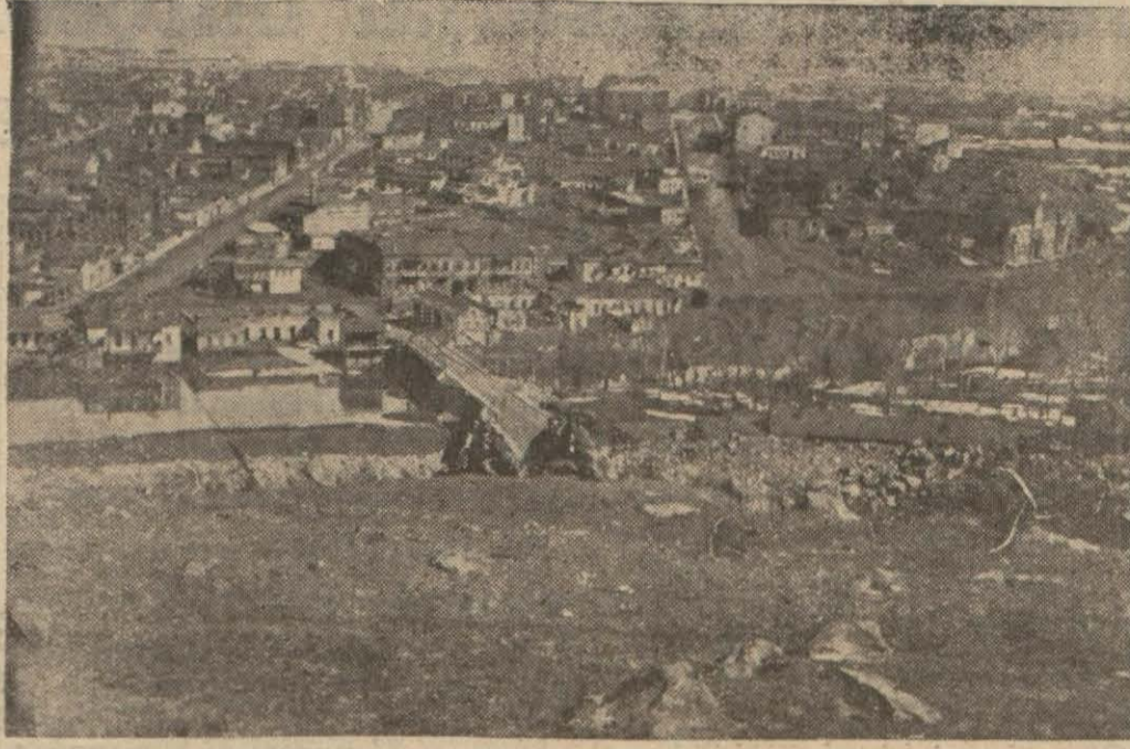
Karsın umumî görünüşü

«Uçmanlarımız, her zaman ve her halde ulusun yüzünü ağartacak yüksek değerdedirler. Lâkin bu kadarını yeter görmek doğru olamazdı. Hava işine, onun bütün dünyada aldığı önem derecesine göre genişlik vermek lâzımdır... Bu ise, Türkü, çocukluğundan, vatan kuşlarıyla, vatan havası içinde yarışa alıştırmakla başlar...» — N. S.