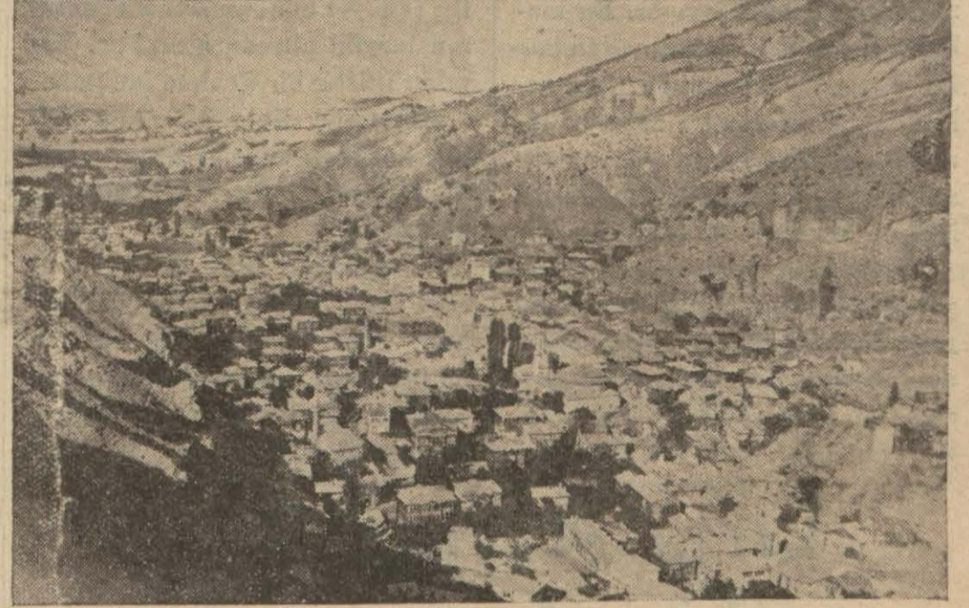
Milâsın umumî görünüşü

Bunlar Milâs ve Ispartada gizlice âyin yapıyorlardı