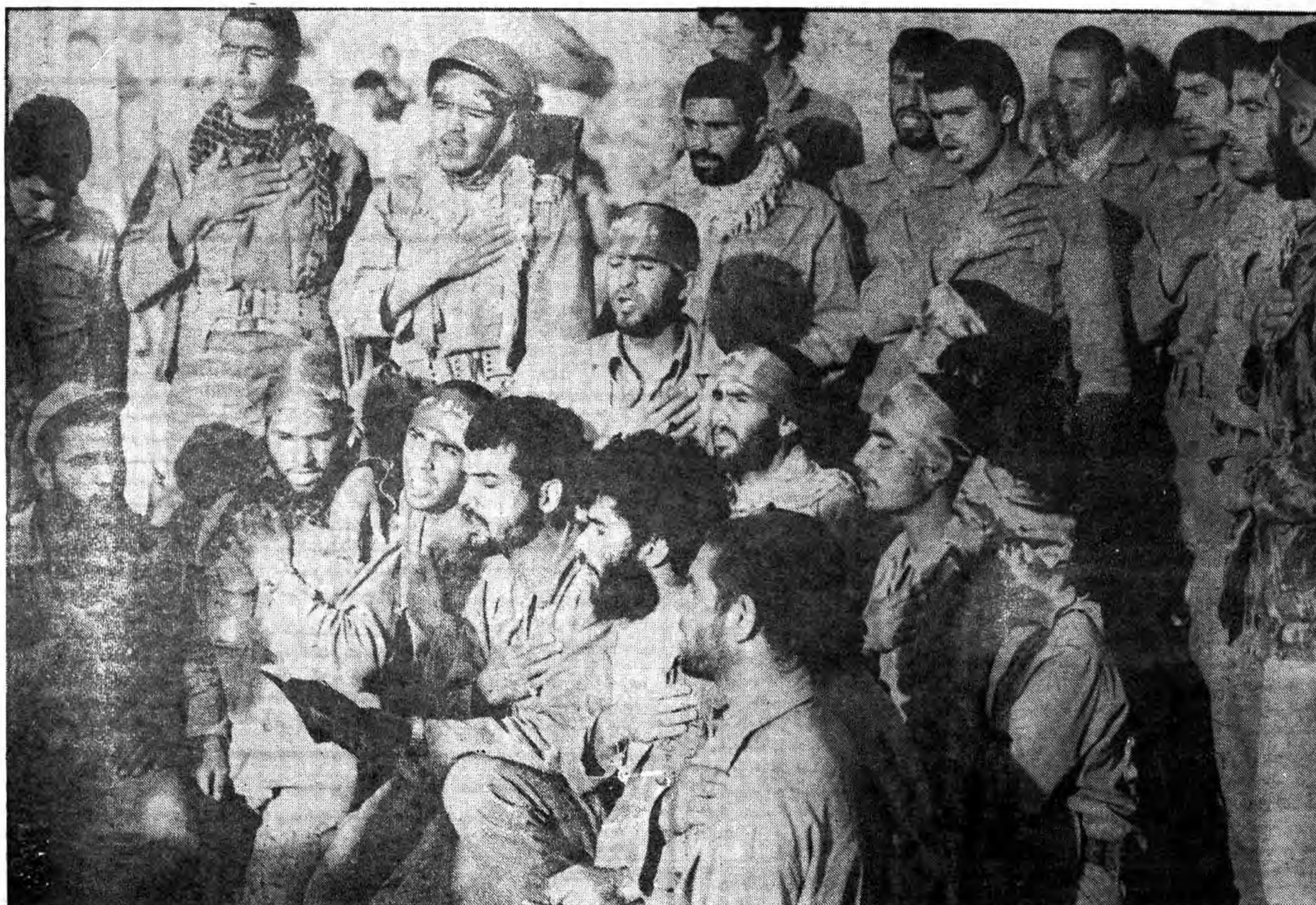
• لحظاتی قبل از حمله: یا وجیها عندالله اشفع لنا عندالله