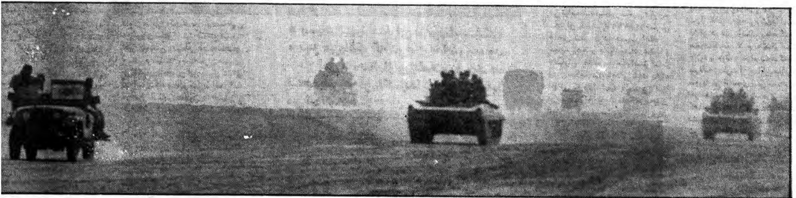
* کربلا ما می آئیم