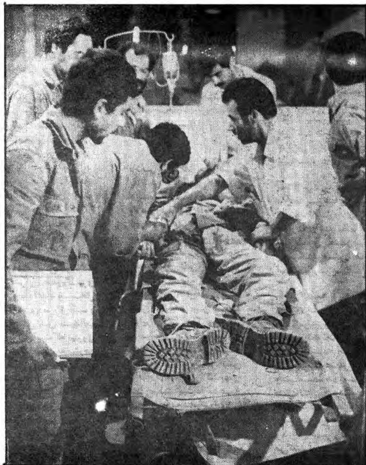
• پزشکان و امدادگران ما با اخلاصی هر چه تمام‌تر اسرای مجروح عراقی را مداوا می‌کنند