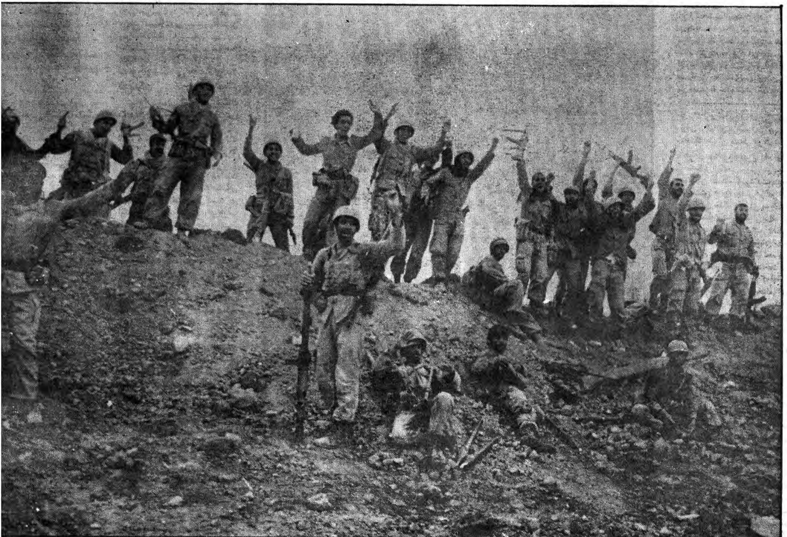
* میرویم و میدانیم که حق همیشه پیروز است