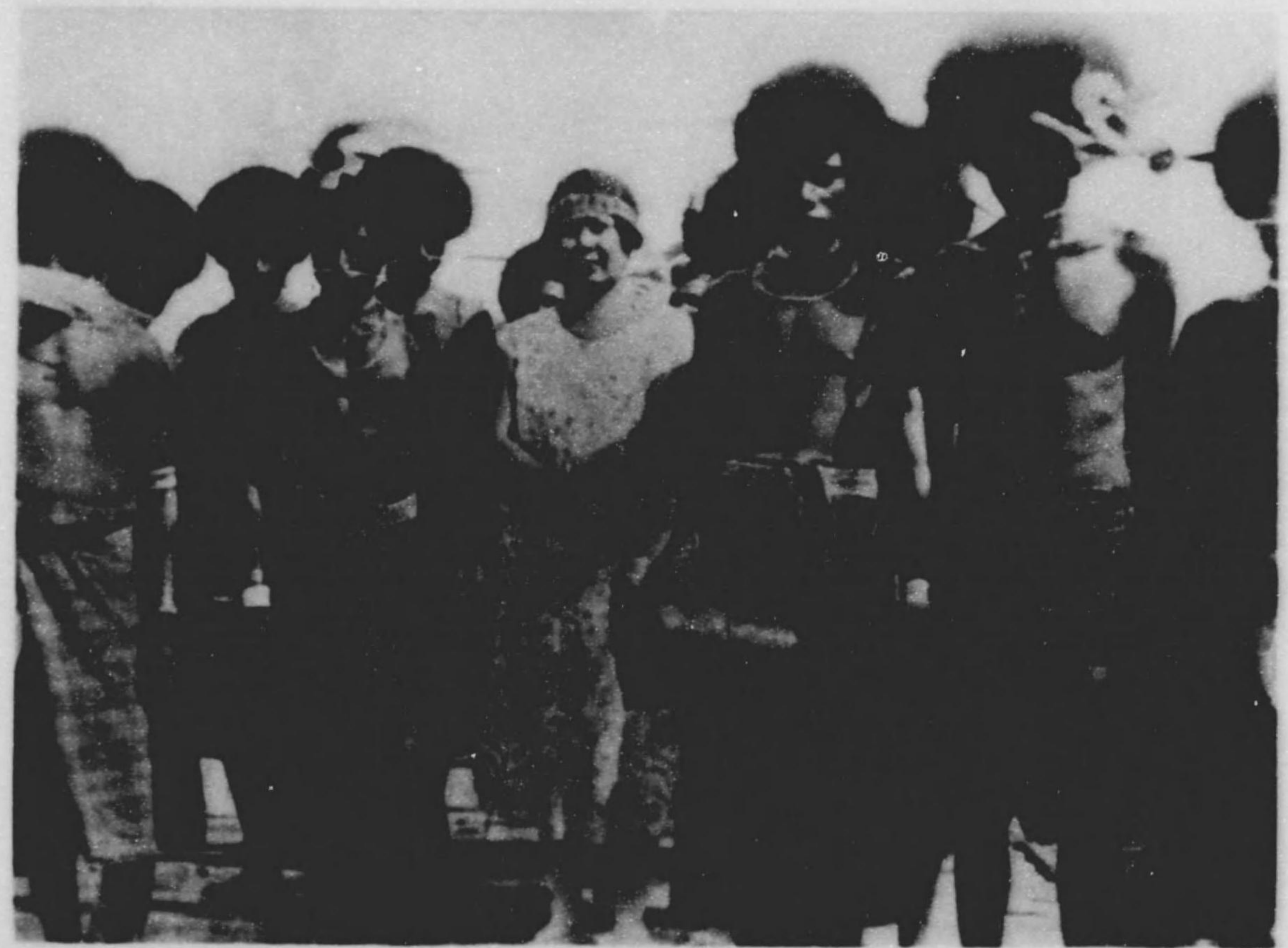
南ニユーギニア海岸部落土人（其ノ一） 同（其ノ二）