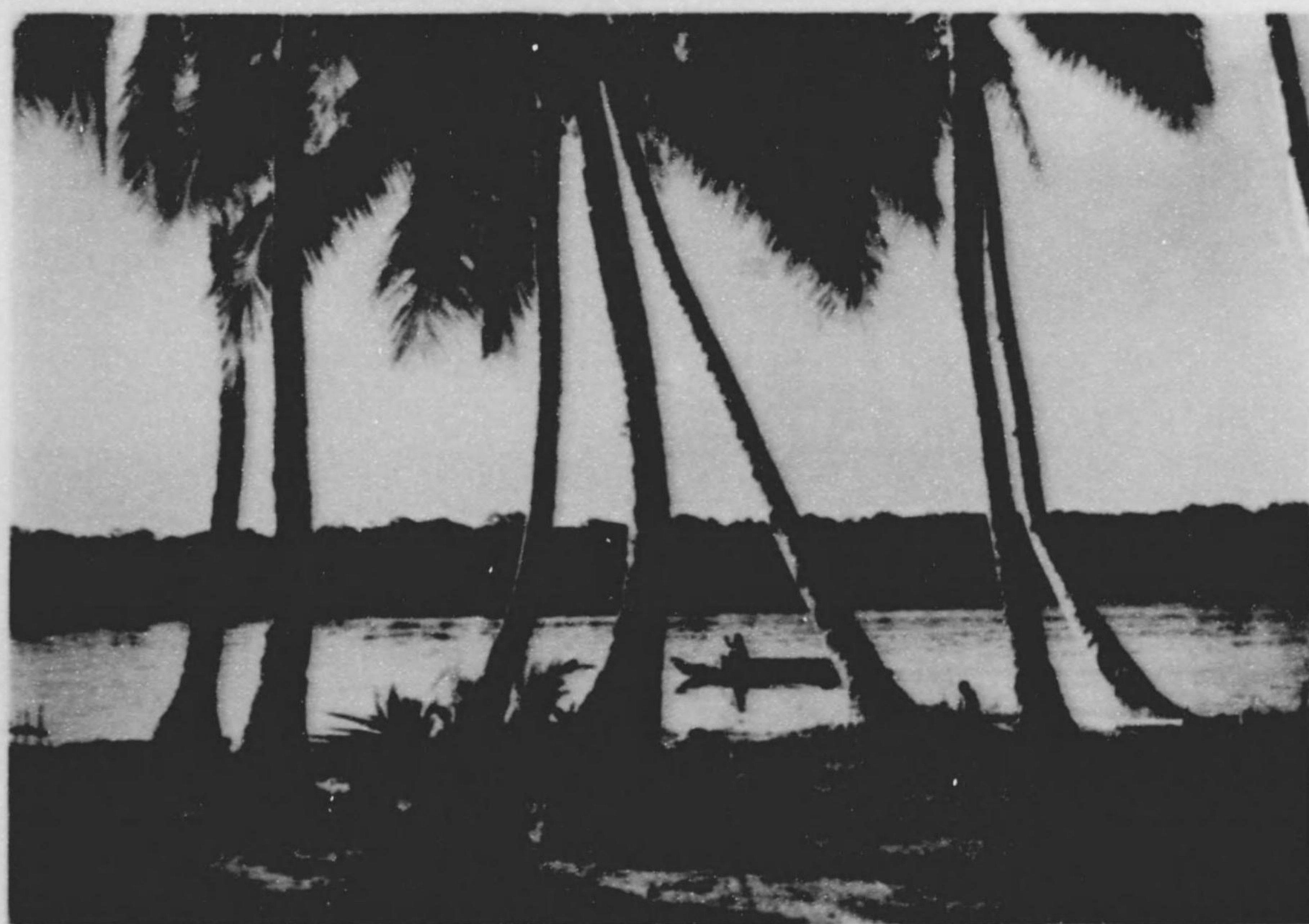
サヌキ地方の青波 マノクワリ地方の青波