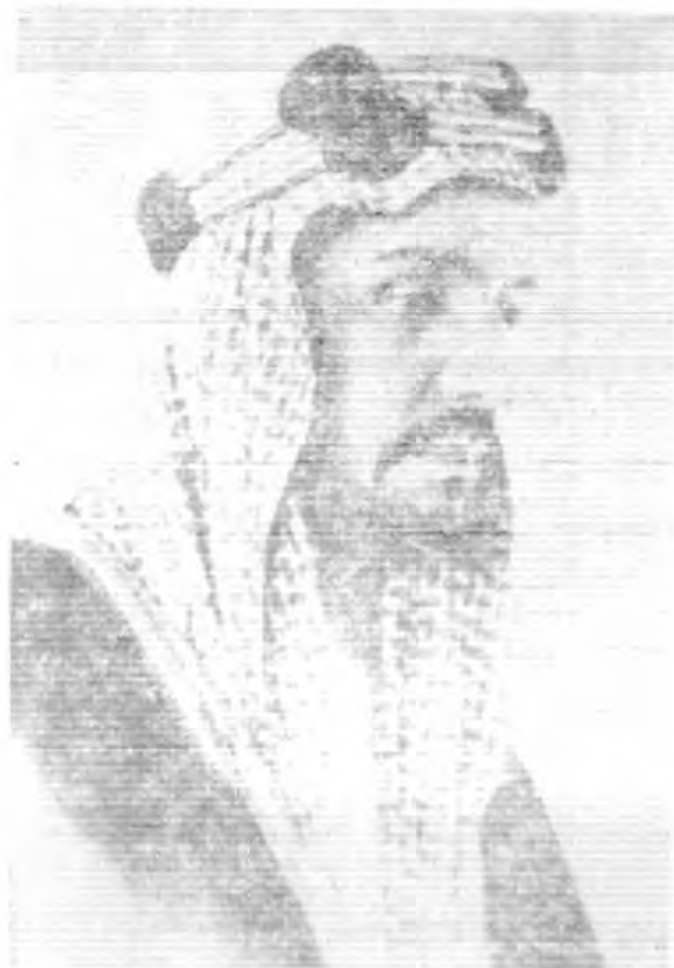
沙烏第阿拉伯國王伊平沙烏德陸

最近伊拉克與沙烏第阿拉伯間成立之阿拉伯親善條約，已經引起各回教國的強烈贊同，據謂：葉門埃及等國均將陸續參加，情勢嚴重，已為各帝國所注目。果能如此，則阿拉伯民族間的親善協作的事實，終必顯現在世人的眼前。安拉誠不辜負吾人的所期望！