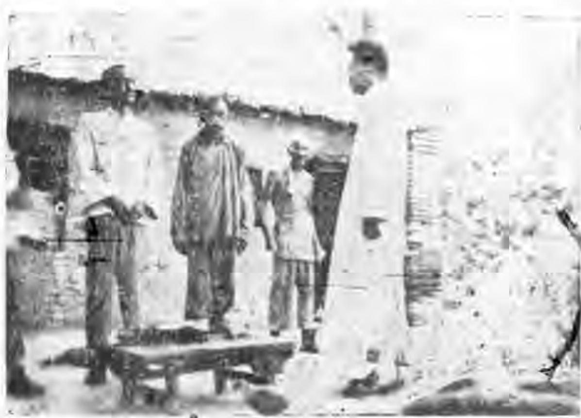
通縣尹各莊茶館前賑調員與農民談話情形

答：合作社就是調劑鄉村金融的好機關，一個村莊成立了合作社，農民就可將餘剩的金錢，存放在裏面，並可藉以生息，這就是一個小儲蓄銀行，急需款子的，也可以到合作社裏來借，利息較低，手續又簡，所以說合作社就足以代替了官銀號的使命，若合作社的業務擴大了，成立了區聯合會，或縣聯合會，資本也隨着擴大了，他的力量還要超過了官銀號，希望各社仍努力於合作吧，各村合作社成立之後，自