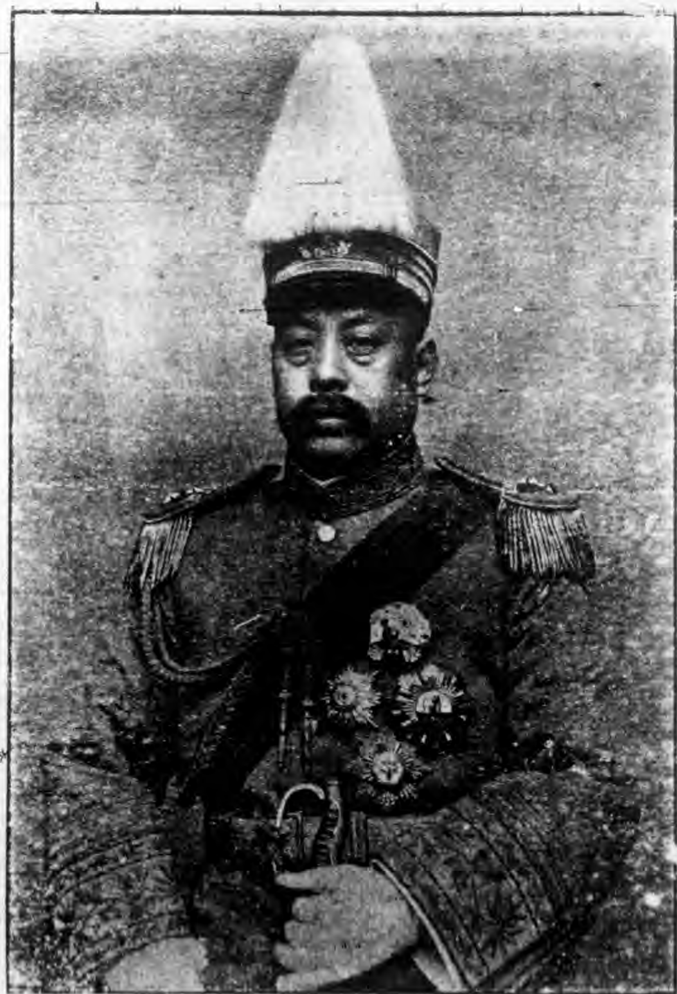
江 西 蔡 督 理 肖 像