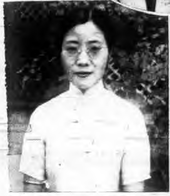
熊三新夫人產女在幼山中待李君 兼君夫毛文士自香慈院招堯