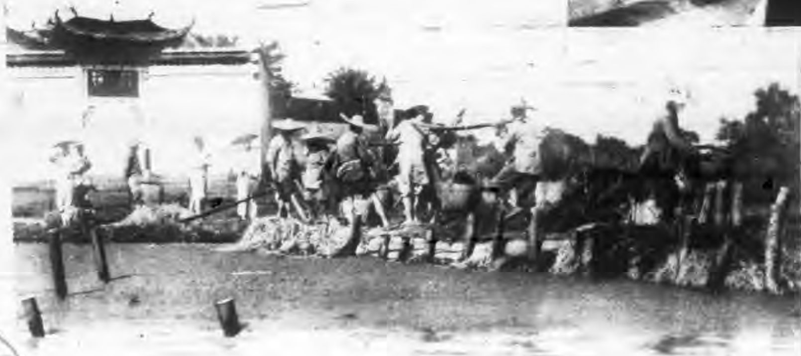
(上)漢口加築江邊堤防 錢江大橋之打樁機及橋墩 鋼板格被大水沖毀情形