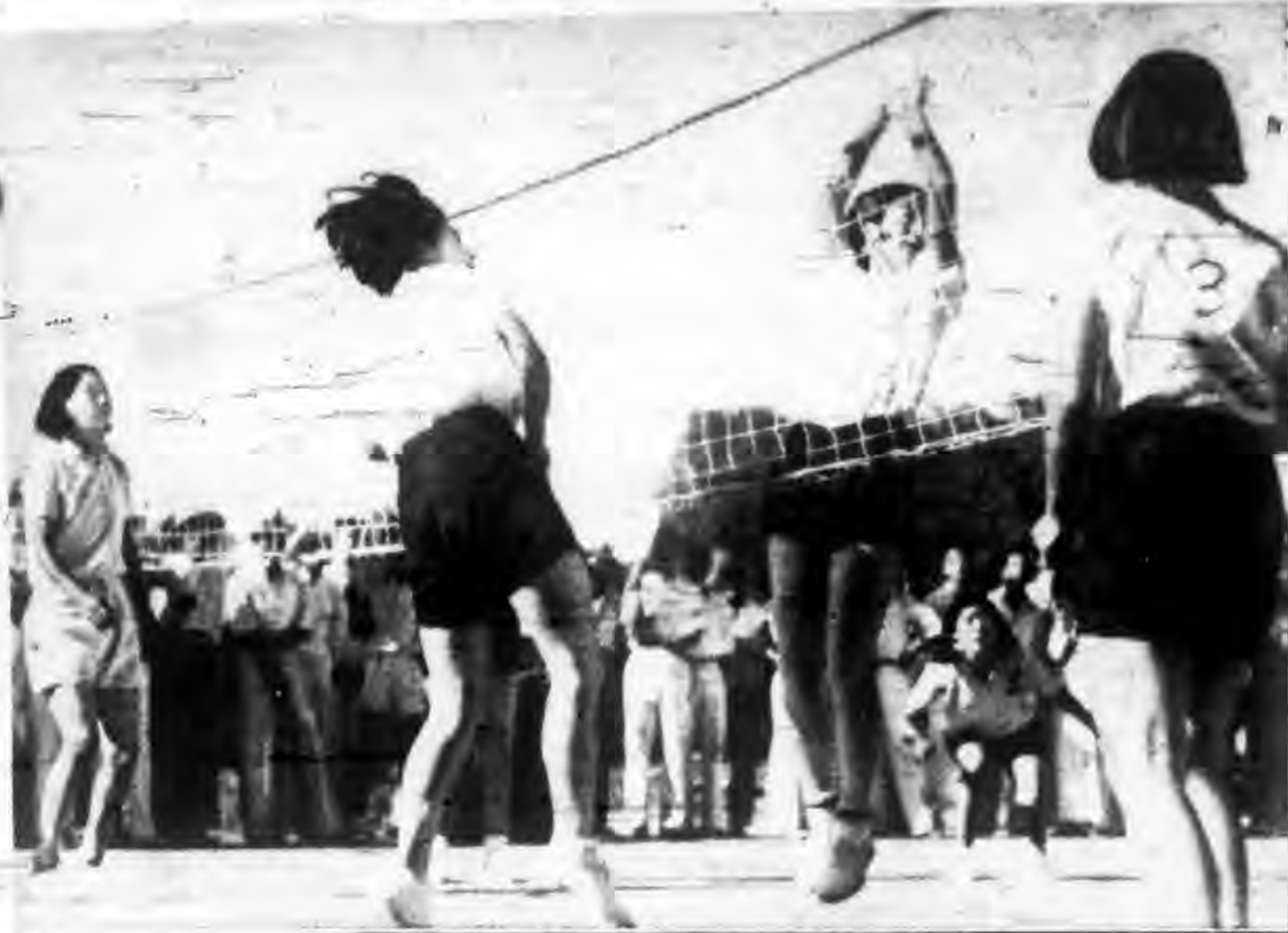
北平參加全運女子排球選拔情形