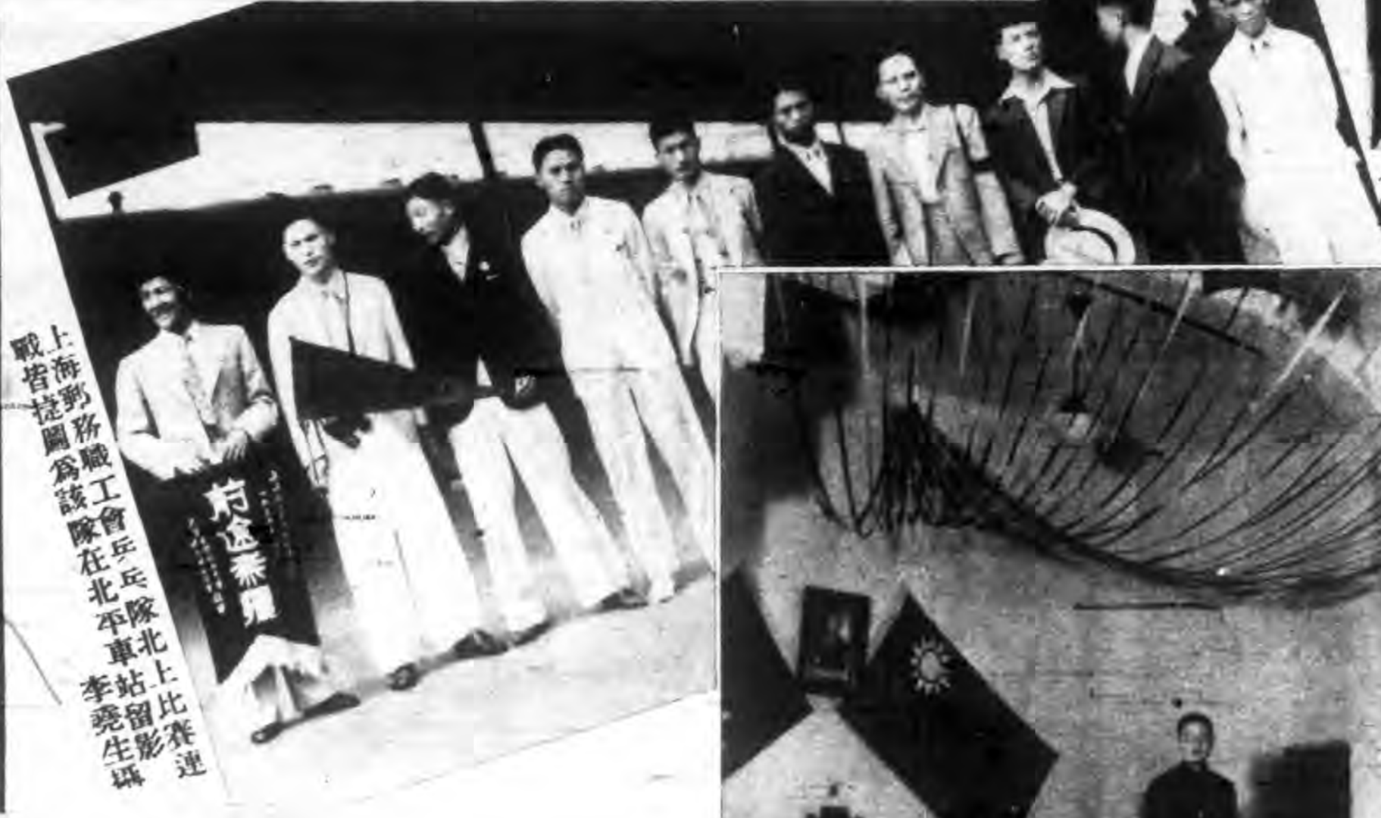
上海郵務職工會乒乓球隊在北平車站留影 戰皆捷圖為該隊在北平車站留影