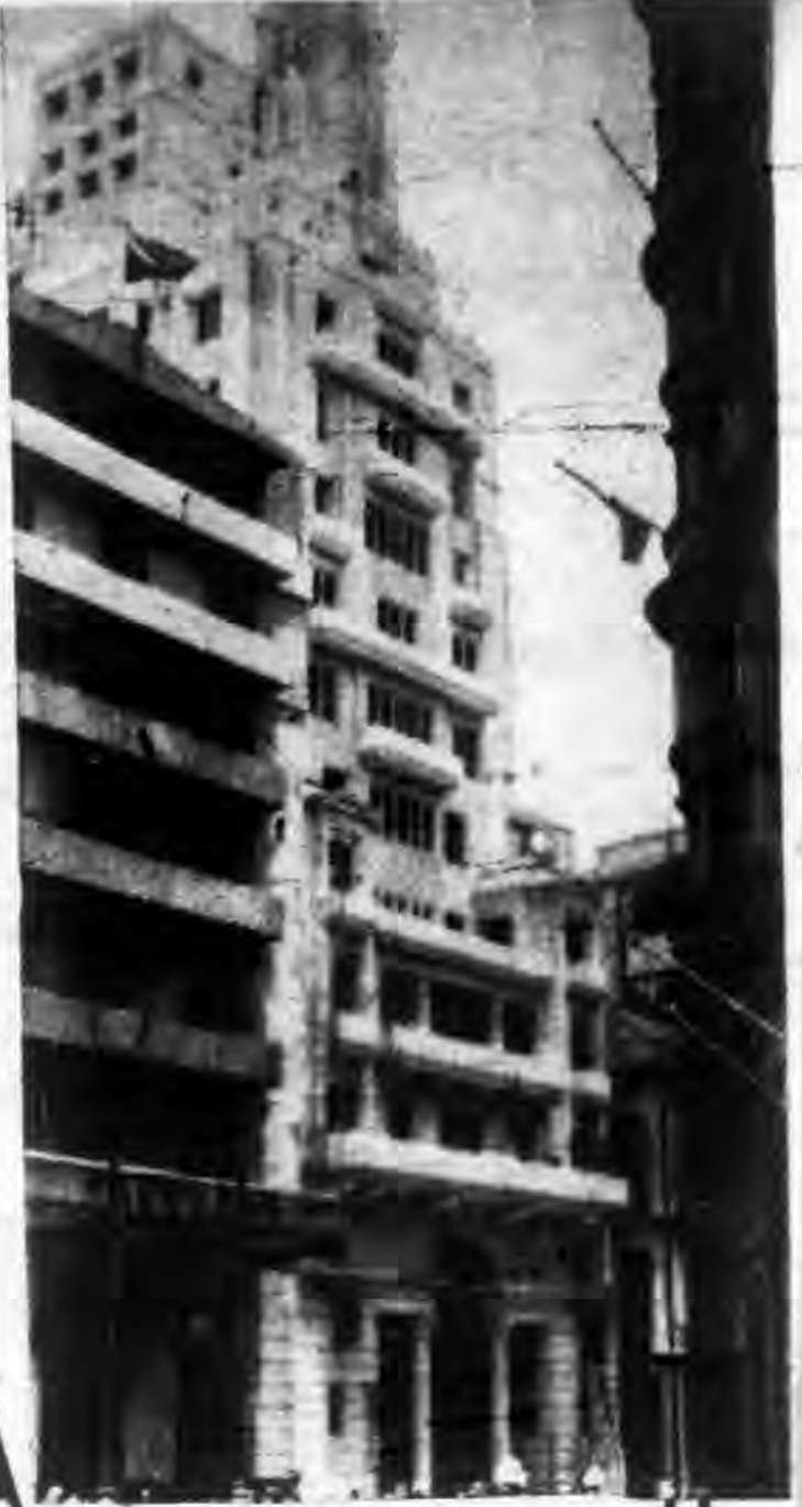
香港東亞銀行之建築新近落成