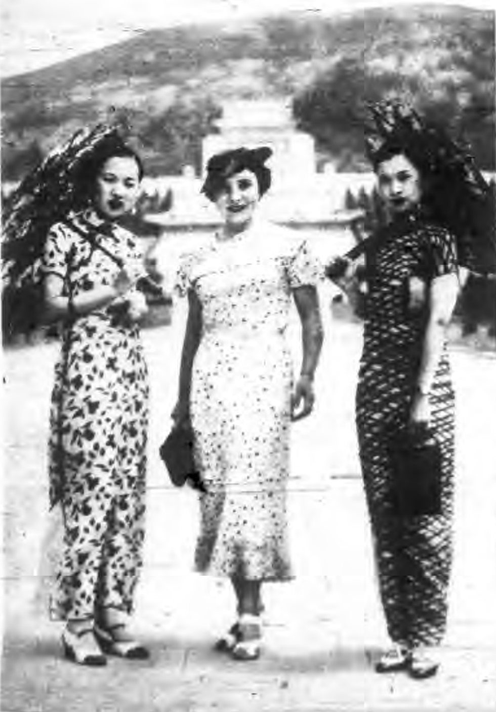
法名女記者阿瑞信揚士提夫人到京謁陵