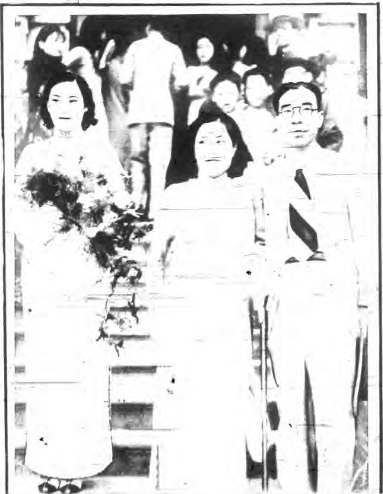
影星胡蝶與周劍雲伉儷載譽歸來